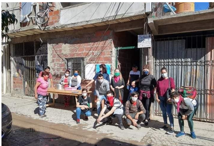
FOTO: Comedor en el barrio de Retiro, CABA