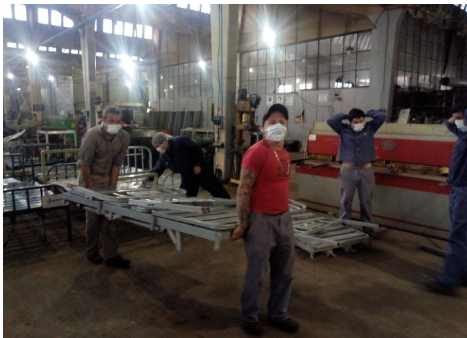
Foto: trabajadores del Astillero Río Santiago reparan camas de hospitales