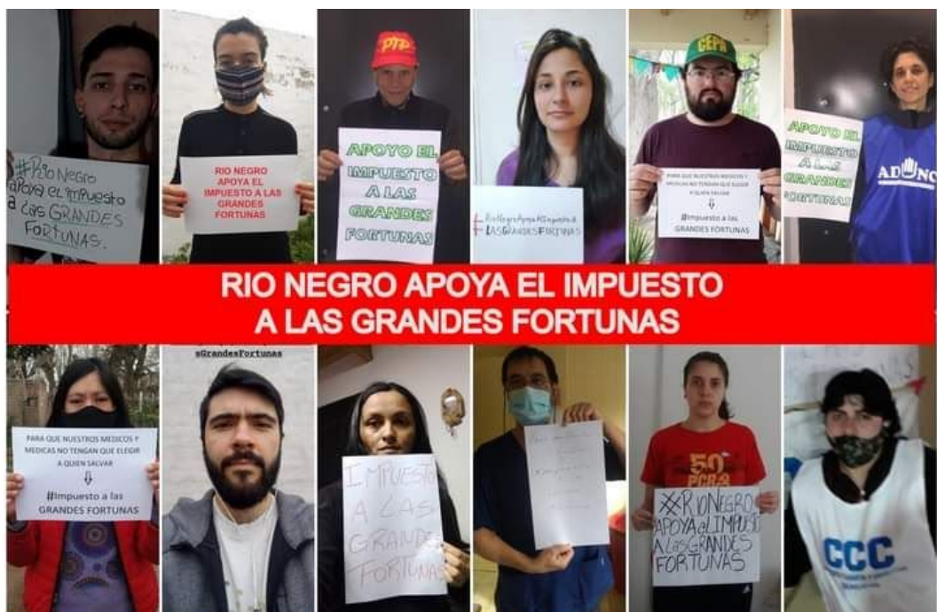
foto: Río Negro. Jornada multisectorial por el impuesto a las grandes fortunas