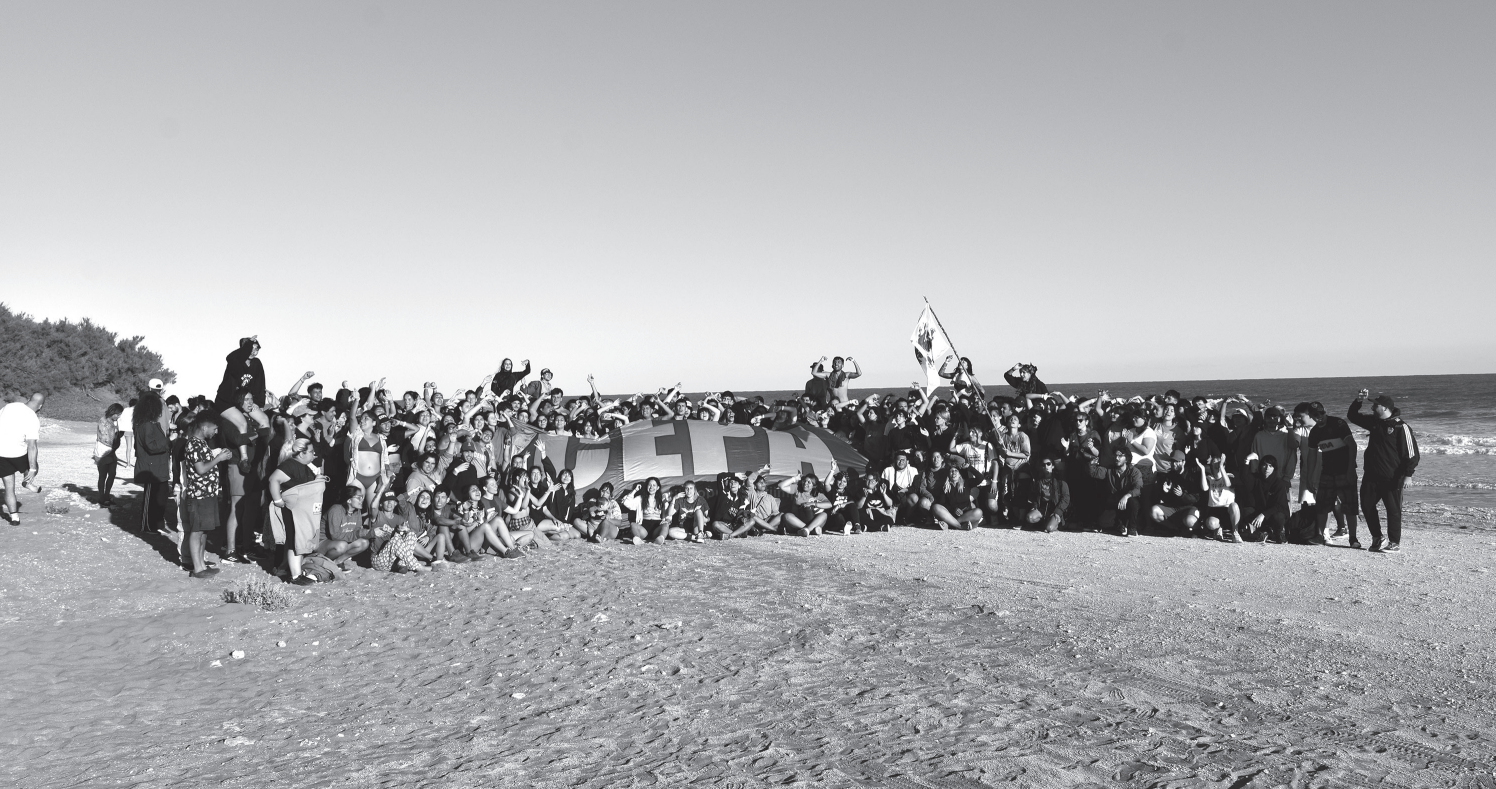
CAMPAMENTO DE ESTUDIANTES UNIVERSITARIOS Y TERCARIOS DE LA CEPA 2024