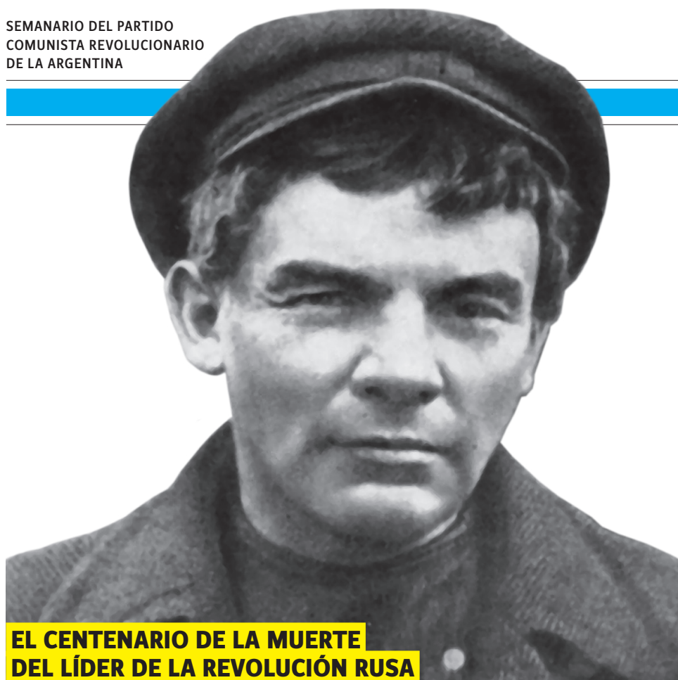
EL CENTENARIO DE LA MUERTE DEL LÍDER DE LA REVOLUCIÓN RUSA

“Crear un periódico político destinado a toda Rusia, como centro de reunión de las fuerzas del Partido, organizar en la base cuadros firmes, como ‘formaciones regulares’ del Partido, reunir estos cuadros por medio del periódico y agruparlos a través de toda Rusia en un Partido de combate, con límites netamente determinados y un programa claro, con una táctica firme y una voluntad única; tal es el plan que Lenin desarrolló en sus célebres obras ¿Qué hacer? y Un paso adelante, dos pasos atrás . Este plan tenía el mérito de corresponder enteramente a la realidad rusa y generalizar magistralmente, en materia de organización, la experiencia de los mejores militantes. En su lucha por la realización de este plan, la mayoría de los militantes rusos