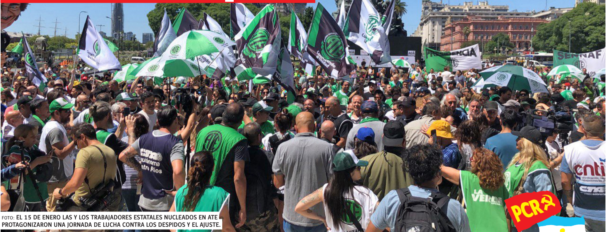
FOTO: EL 15 DE ENERO LAS Y LOS TRABAJADORES ESTATALES NUCLEADOS EN ATE PROTAGONIZARON UNA JORNADA DE LUCHA CONTRA LOS DESPIDOS Y EL AJUSTE.