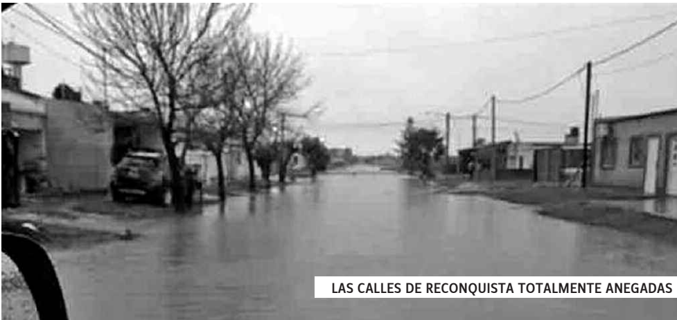
LAS CALLES DE RECONQUISTA TOTALMENTE ANEGADAS

Reconquista, Vera, Malabrigo, etc., han alcanzado en los últimos días niveles de agua pocas veces vistos en la zona, casi en horas, con lo que han colapsado todos los sistemas de desagüe. Las