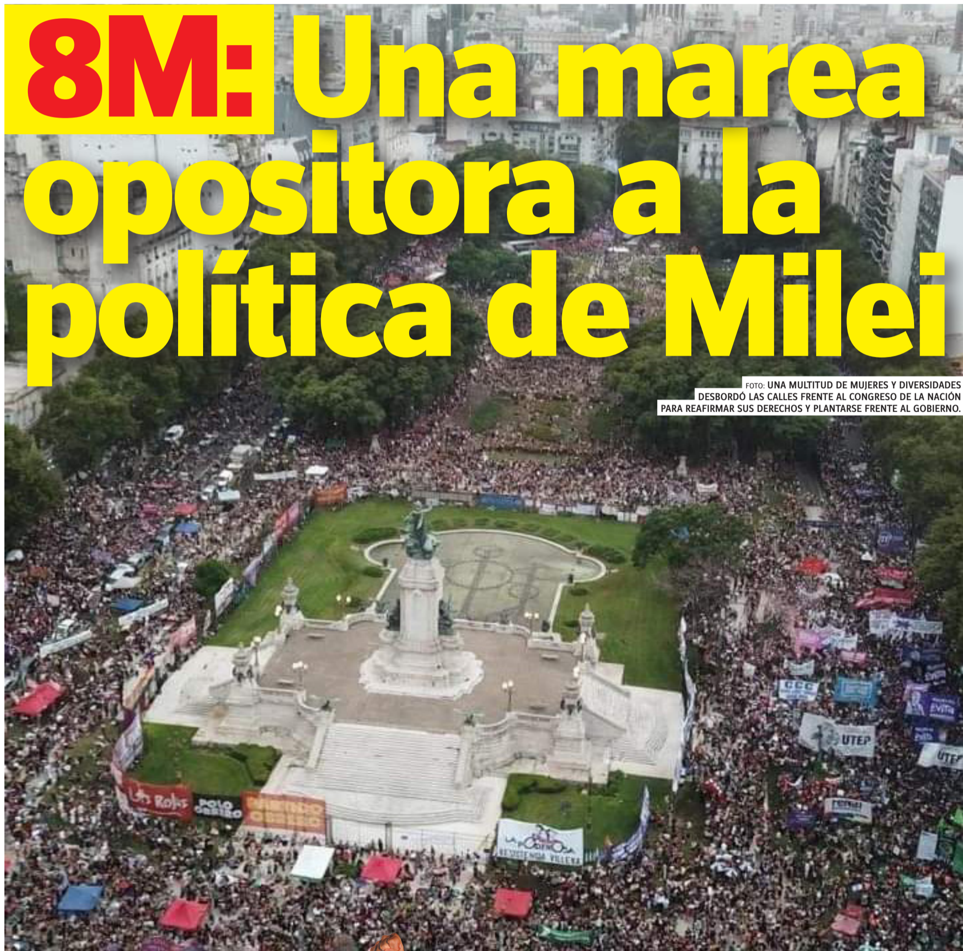
FOTO: UNA MULTITUD DE MUJERES Y DIVERSIDADES DESBORDÓ LAS CALLES FRENTE AL CONGRESO DE LA NACIÓN PARA REAFIRMAR SUS DERECHOS Y PLANTARSE FRENTE AL GOBIERNO.

En el Día Internacional de las Mujeres Trabajadoras el movimiento de mujeres y diversidades de la Argentina dio una contundente respuesta a la política de este gobierno que ajusta y quita derechos a las mujeres y a todo el pueblo. Fue un gran paso en el camino de un nuevo paro general en la pelea por torcerle el brazo a la política de Milei.