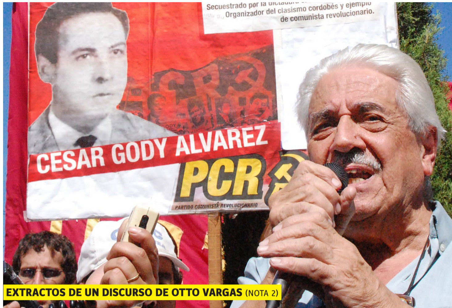
EXTRACTOS DE UN DISCURSO DE OTTO VARGAS (NOTA 2)

Esta vertiente, por caminos muy complicados –como se vio en la Argentina con el caso de Montoneros y otros– fue "ensillada" por el socialimperialismo soviético. Porque sus dirigentes consideraban que la Unión Soviética era amiga de los pueblos. Los trotskistas hasta hace poco hablaban de "estado obrero con deformaciones burocráticas", después de 20 o 30 años que la URSS era un país imperialista, no sólo por sus inversiones de capital