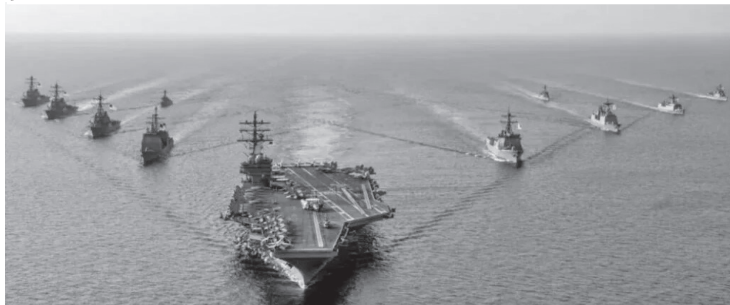
FOTO: EL GOBIERNO DE ESTADOS UNIDOS DESPLEGÓ 12 BUQUES DE GUERRA, EL PORTAAVIONES MÁS GRANDE DE SU FLOTA Y CERCA DE 15 MIL EFECTIVOS EN EL CARIBE AMENAZANDO A VENEZUELA