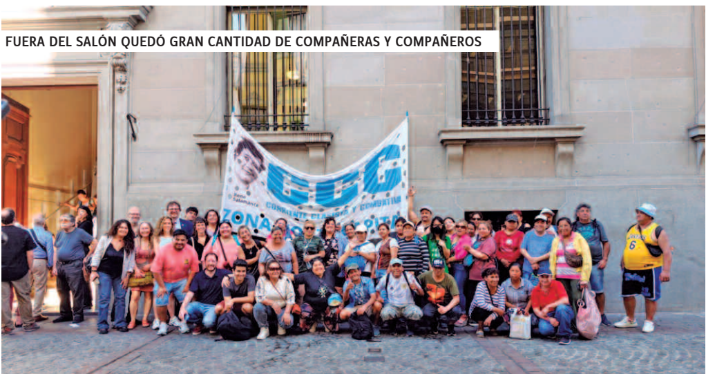
FUERA DEL SALÓN QUEDÓ GRAN CANTIDAD DE COMPAÑERAS Y COMPAÑEROS