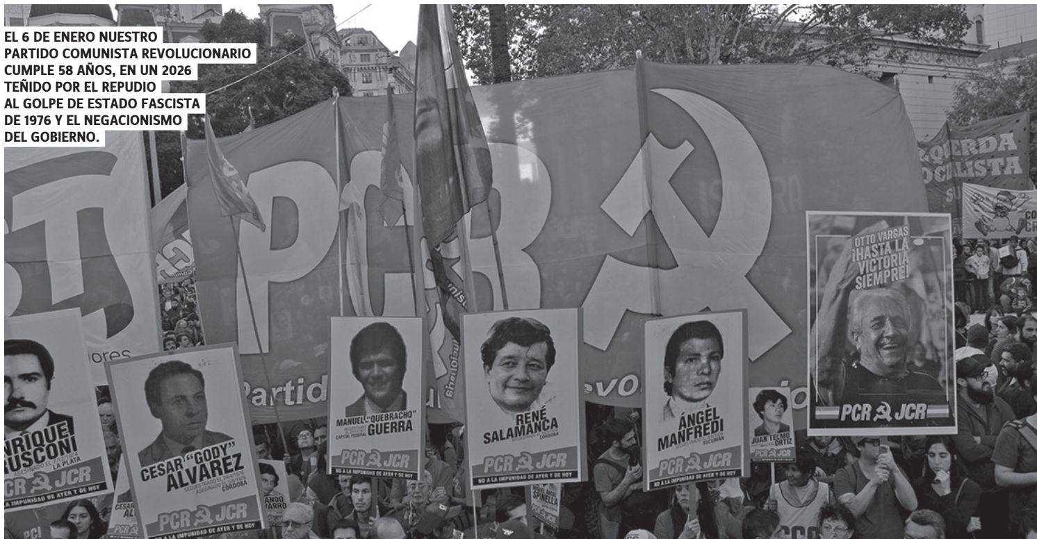
EL 6 DE ENERO NUESTRO PARTIDO COMUNISTA REVOLUCIONARIO CUMPLE 58 AÑOS, EN UN 2026 TEÑIDO POR EL REPUDIO AL GOLPE DE ESTADO FASCISTA DE 1976 Y EL NEGACIONISMO DEL GOBIERNO.

mundo y en los propios países imperialistas.