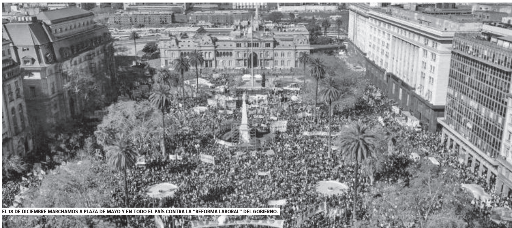
EL 18 DE DICIEMBRE MARCHAMOS A PLAZA DE MAYO Y EN TODO EL PAÍS CONTRA LA "REFORMA LABORAL" DEL GOBIERNO.