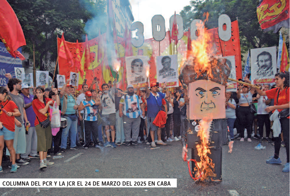
COLUMNA DEL PCR Y LA JCR EL 24 DE MARZO DEL 2025 EN CABA

El gobierno combina un ajuste feroz con lo que llama “batalla cultural”, intentando imponer una serie de mentiras