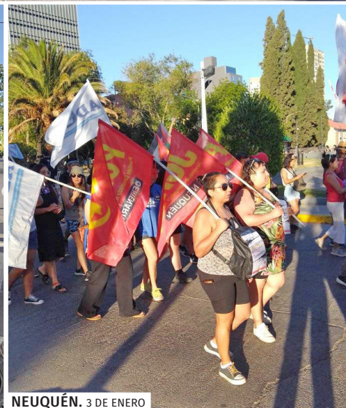
NEUQUÉN. 3 DE ENERO