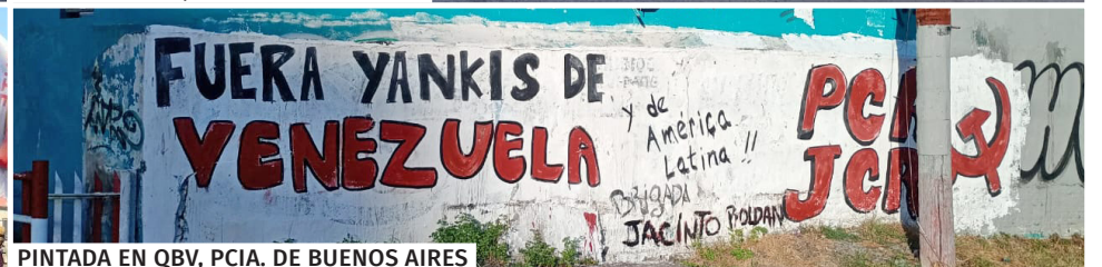
PINTADA EN QBV, PCIA. DE BUENOS AIRES