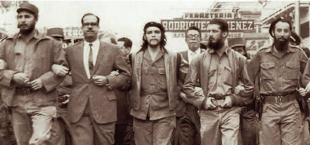
FIDEL, EL CHE Y URRUTIA,PRIMER PRESIDENTE TRAS LA REVOLUCIÓN, MARCHANDO EN LA HABANA

El 1º de enero se conmemoraron 67 años del triunfo de la primera revolución triunfante en América Latina.