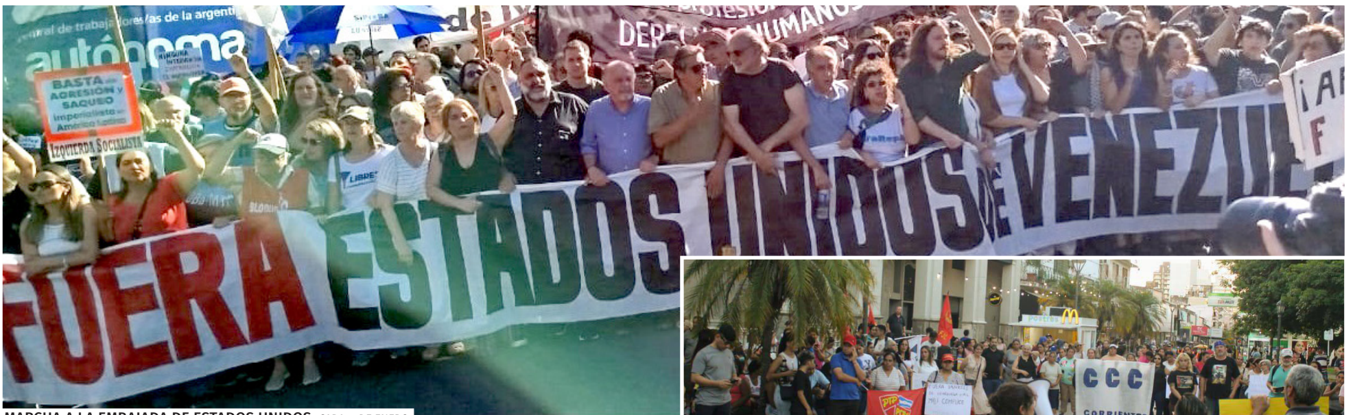
MARCHA A LA EMBAJADA DE ESTADOS UNIDOS. CABA, 5 DE ENERO

Reproducimos fotos de algunas de las actividades realizadas hasta el 5 de enero.■