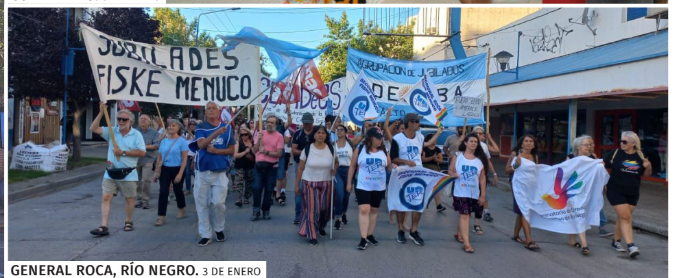
GENERAL ROCA, RÍO NEGRO. 3 DE ENERO