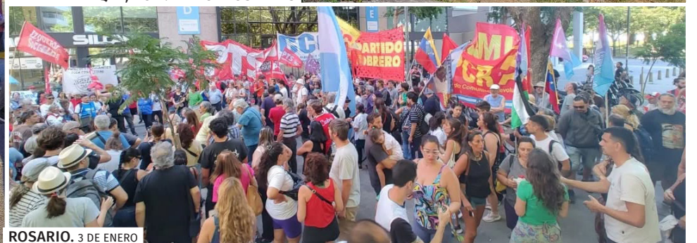
ROSARIO. 3 DE ENERO