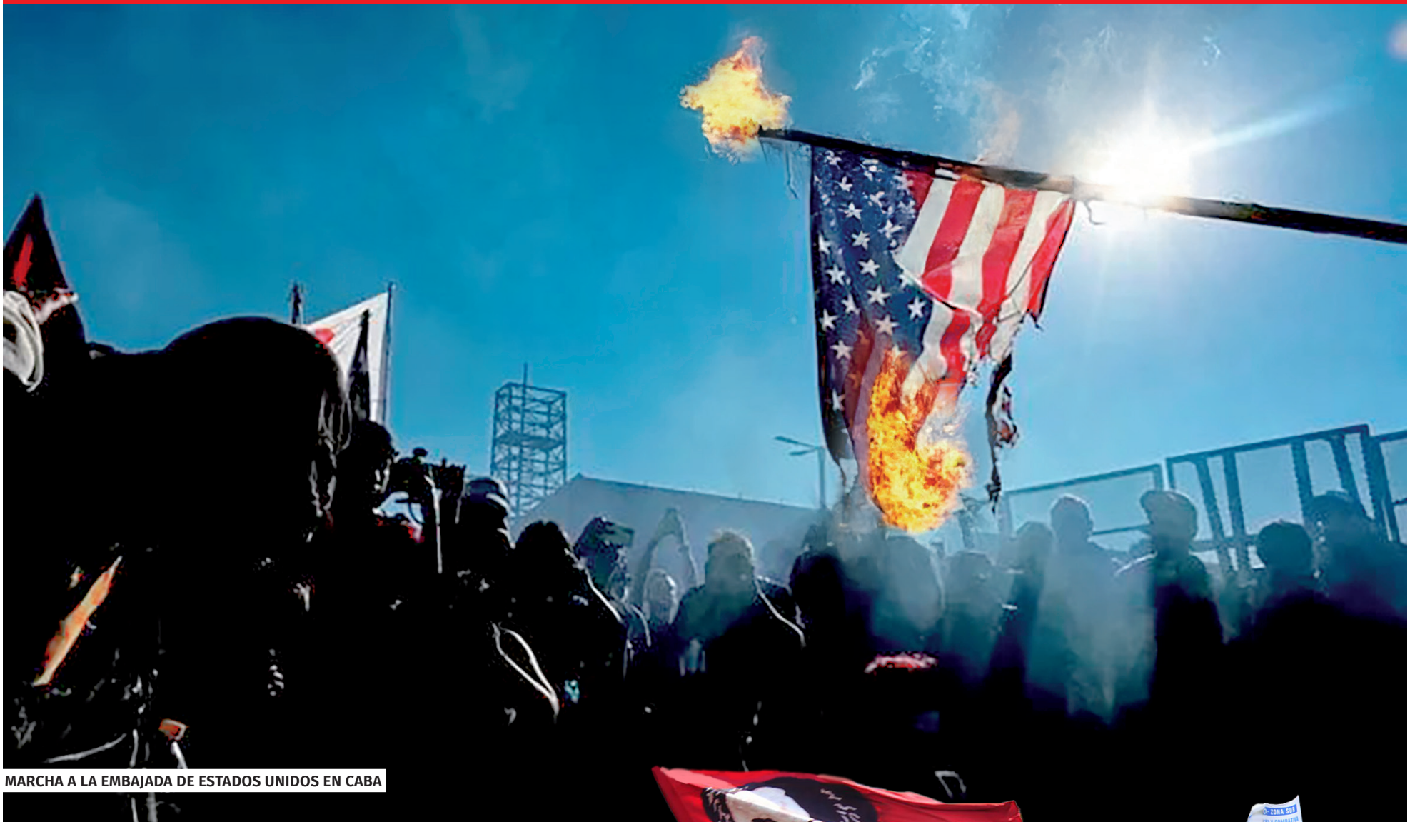
MARCHA A LA EMBAJADA DE ESTADOS UNIDOS EN CABA

EL 6 DE ENERO CUMPLIMOS 58 AÑOS PELEANDO POR LA REVOLUCIÓN EN LA ARGENTINA