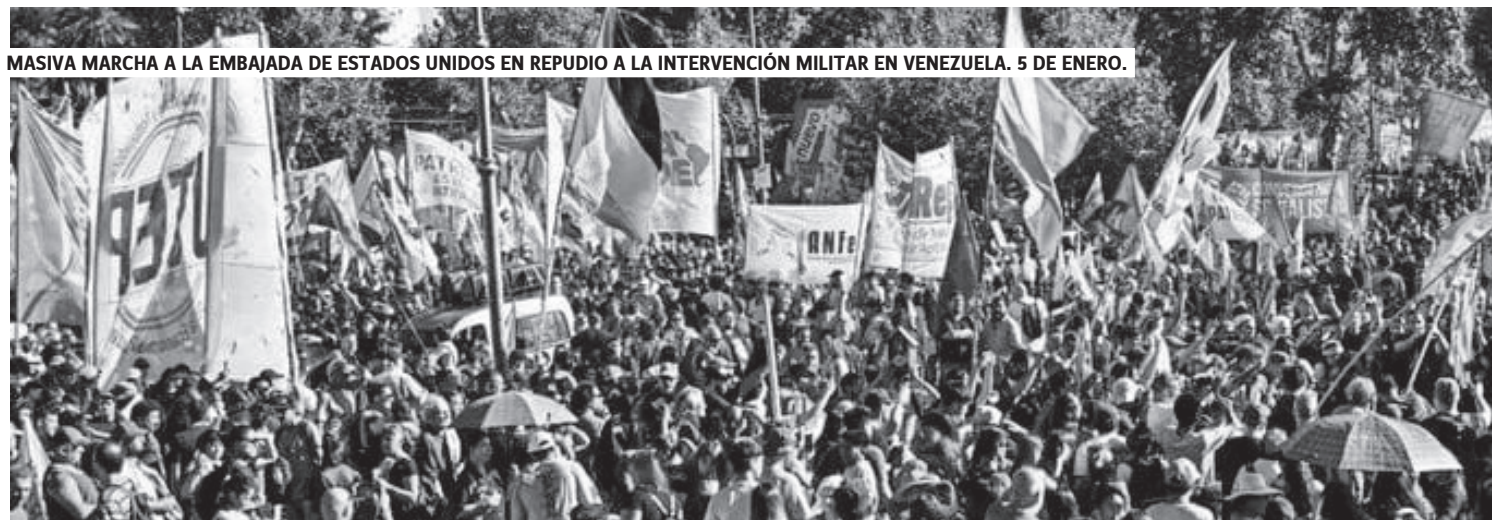
MASIVA MARCHA A LA EMBAJADA DE ESTADOS UNIDOS EN REPUDIO A LA INTERVENCIÓN MILITAR EN VENEZUELA. 5 DE ENERO.