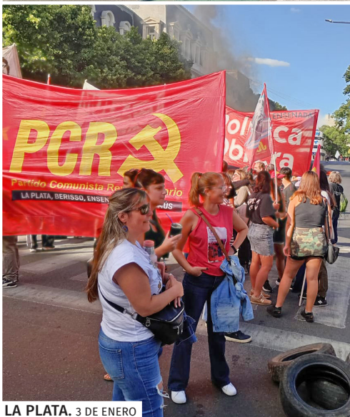
LA PLATA. 3 DE ENERO