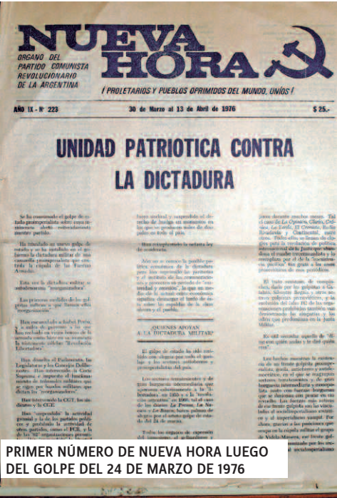
PRIMER NÚMERO DE NUEVA HORA LUEGO DEL GOLPE DEL 24 DE MARZO DE 1976

“El segundo es que se niegan las grandes luchas durante los años de la dictadura. Pareciera que en esos años en la Argentina no pasó nada. Pero esas luchas son las que explican por qué, mientras la dictadura de Pinochet duró 17 años, y hasta hace poco era senador vitalicio, y la dic-