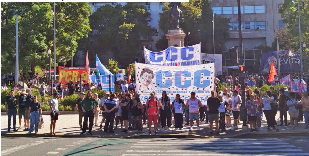
CORRIENTES. 3 DE ENERO