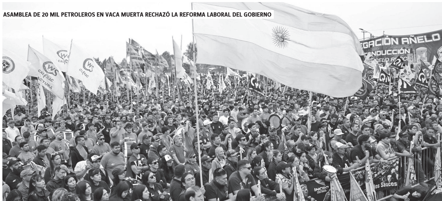
ASAMBLEA DE 20 MIL PETROLEROS EN VACA MUERTA RECHAZÓ LA REFORMA LABORAL DEL GOBIERNO