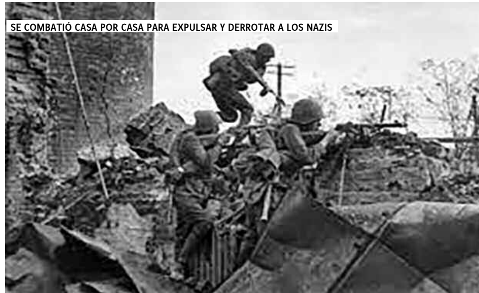
SE COMBATIÓ CASA POR CASA PARA EXPULSAR Y DERROTAR A LOS NAZIS

José Stalin estaba al frente del Partido Comunista de la URSS y del Estado, luego de la muerte de Lenin en 1924. Con errores que costarían caro al proceso revolucionario, Stalin defendió el socialismo, y la sociedad avanzó con una profunda colectivización del campo y un de-