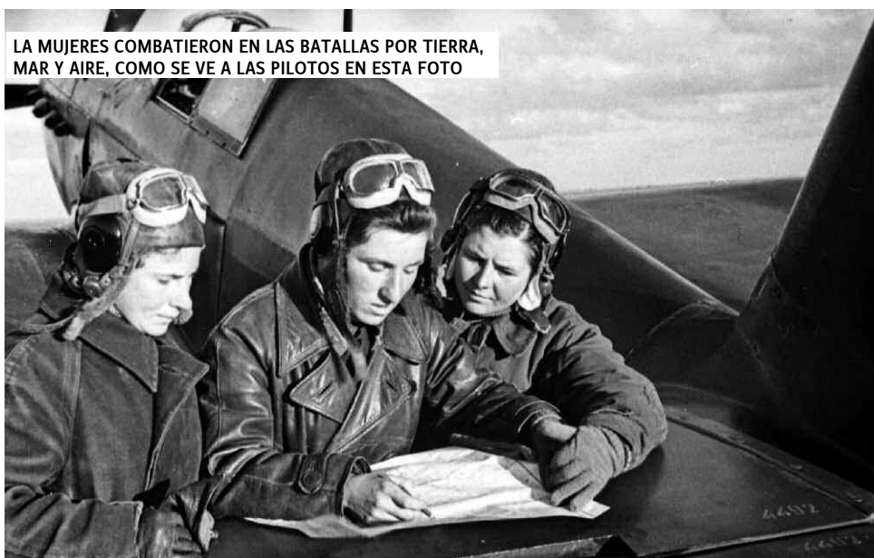
LA MUJERES COMBATIERON EN LAS BATALLAS POR TIERRA, MAR Y AIRE, COMO SE VE A LAS PILOTOS EN ESTA FOTO

Con el ejemplo del pueblo y las y los comunistas soviéticos en Stalingrado, redoblamos la solidaridad internacionalista con todos los pueblos que luchan por su liberación y autodeterminación, denunciemos los planes guerrillistas de las grandes potencias.