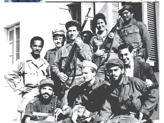
CON INTEGRANTES DE LA COLUMNA DEL CHE EN EL CUARTEL LA CABAÑA, CUBA