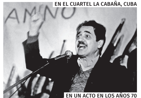
EN UN ACTO EN LOS AÑOS 70