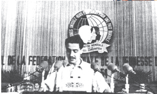
EN PEKIN, CHINA (1954)