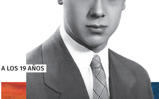
A LOS 19 AÑOS