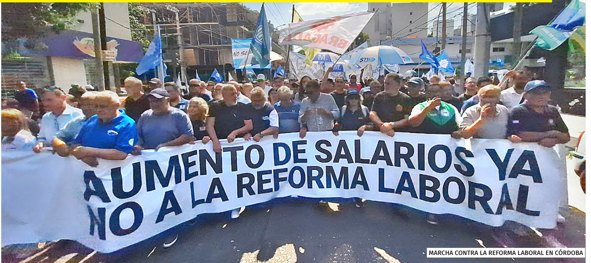
MARCHA CONTRA LA REFORMA LABORAL EN CÓRDOBA

EN LAS CALLES REPUDIANDO LA POLÍTICA DE AJUSTE Y ODIO DE MILEI