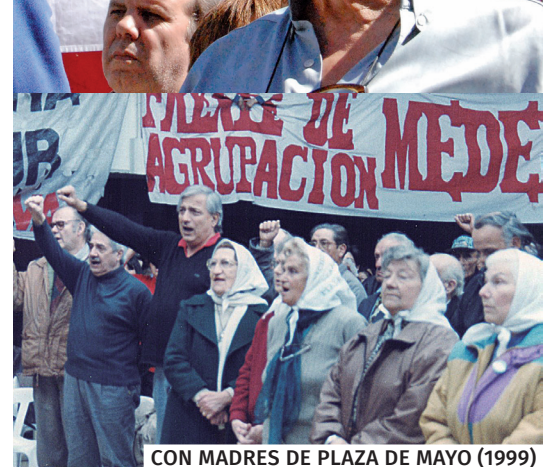
CON MADRES DE PLAZA DE MAYO (1999)