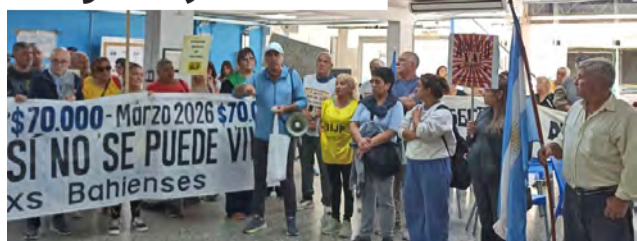
Ocupación de la sede del PAMI en Bahía Blanca

FRENTE A LA VIOLENCIA LA SALIDA ES LA ORGANIZACIÓN