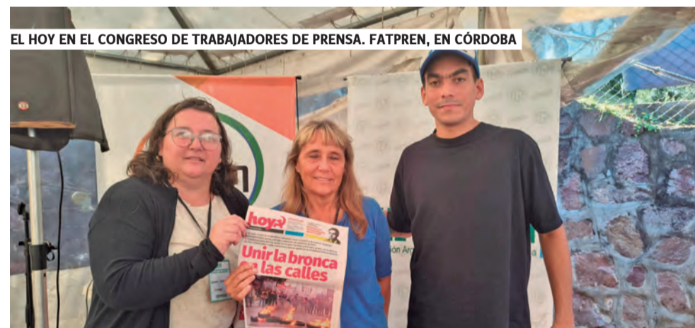
EL HOY EN EL CONGRESO DE TRABAJADORES DE PRENSA. FATPREN, EN CÓRDOBA

de sostener la prensa. En la Zona Norte de CABA se vendieron tortas fritas. En Córdoba, empanadas. En Salta hicieron