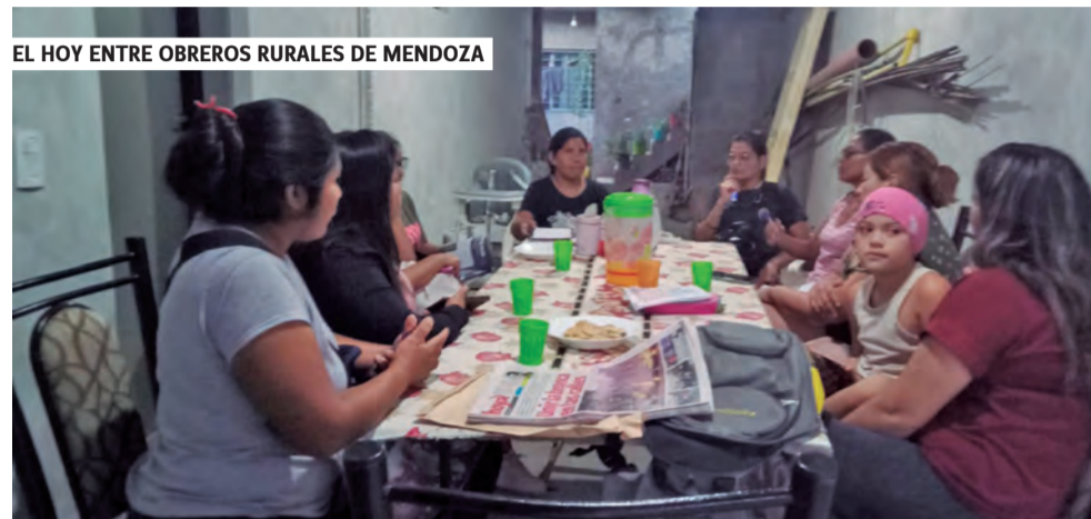
EL HOY ENTRE OBREROS RURALES DE MENDOZA