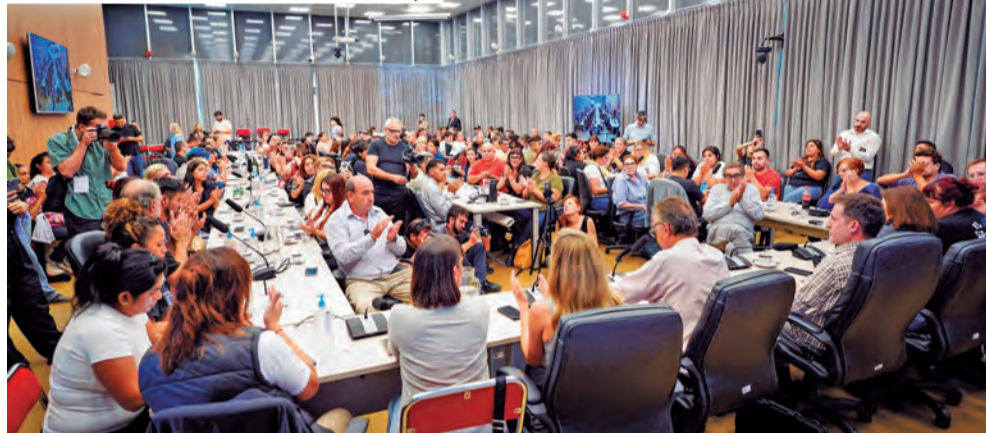
AUDIENCIA PÚBLICA EN LA CÁMARA DE DIPUTADOS DENUNCIANDO EL CIERRE DEL PROGRAMA VOLVER AL TRABAJO

dad del plan de lucha. Si bien se pudo avanzar, todavía no está bien definido qué es lo que se va a hacer en concreto. "Está planteado que el 7 de mayo, que sería el primer día que no se cobra después de 10 años del salario social, mar-