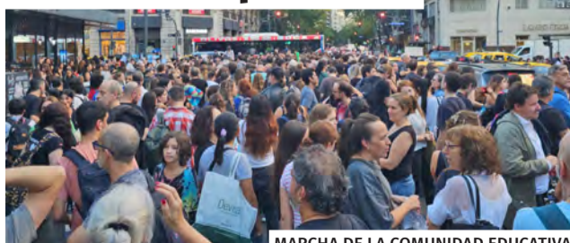
MARCHA DE LA COMUNIDAD EDUCATIVA DEL COLEGIO CARLOS PELLEGRINI EN CABA

Los pibes y las pibas no somos el problema