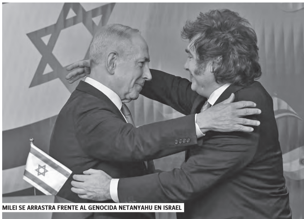
MILEI SE ARRASTRA FRENTE AL GENOCIDA NETANYAHU EN ISRAEL

El gobierno se niega a aplicar la Ley de Financiamiento Universitario, votada seis veces en el Congreso y ratificada judicialmente. Por eso la semana pasada hubo paros, marchas y clases públicas en las universidades nacionales que continúan estos días, y se prepara una nueva marcha nacional para la