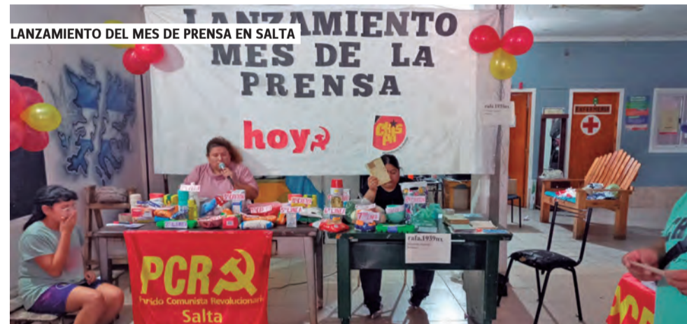
LANZAMIENTO DEL MES DE LA PRENSA EN SALTA