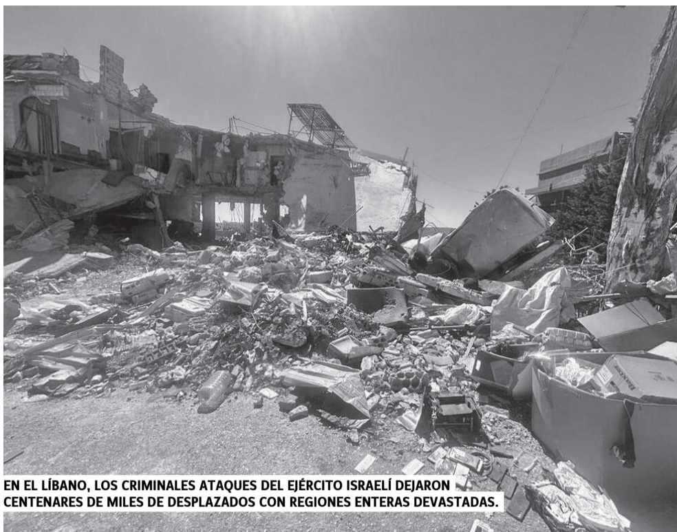
EN EL LÍBANO, LOS CRIMINALES ATAQUES DEL EJÉRCITO ISRAELÍ DEJARON CENTENARES DE MILES DE DESPLAZADOS CON REGIONES ENTERAS DEVASTADAS.

El gobierno nacional, lo ratificó Milei, no tiene otro programa económico que el ajuste permanente. Es una aspiradora de los fondos de las provincias, de las y los jubilados, de la salud, de la educación y de los programas sociales, para un par de canillas, la de la deuda externa y usuraria, y la de los grandes monopolios petroleros, mineros, agroexportadores y la timba financiera. La semana pasada las transferencias a las provincias se redujeron más de un 65%, y como muchos gobiernos provinciales descargan el ajuste en sus trabajadores, crecen los conflictos de estatales (nacionales, provinciales y municipales) y docentes en casi todo el país.