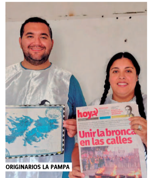
ORIGINARIOS LA PAMPA

debate, emoción y por sobre todo de mucha, mucha militancia.