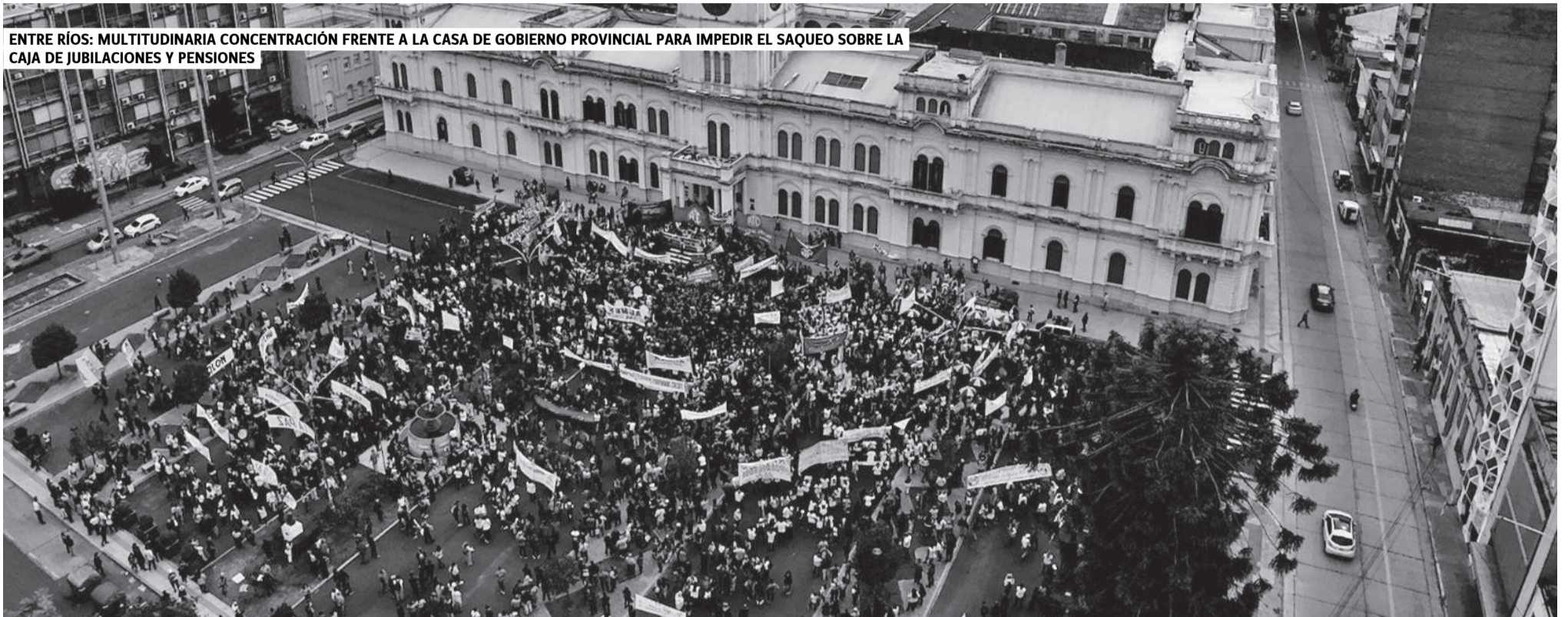
ENTRE RÍOS: MULTITUDINARIA CONCENTRACIÓN FRENTE A LA CASA DE GOBIERNO PROVINCIAL PARA IMPEDIR EL SAQUEO SOBRE LA CAJA DE JUBILACIONES Y PENSIONES