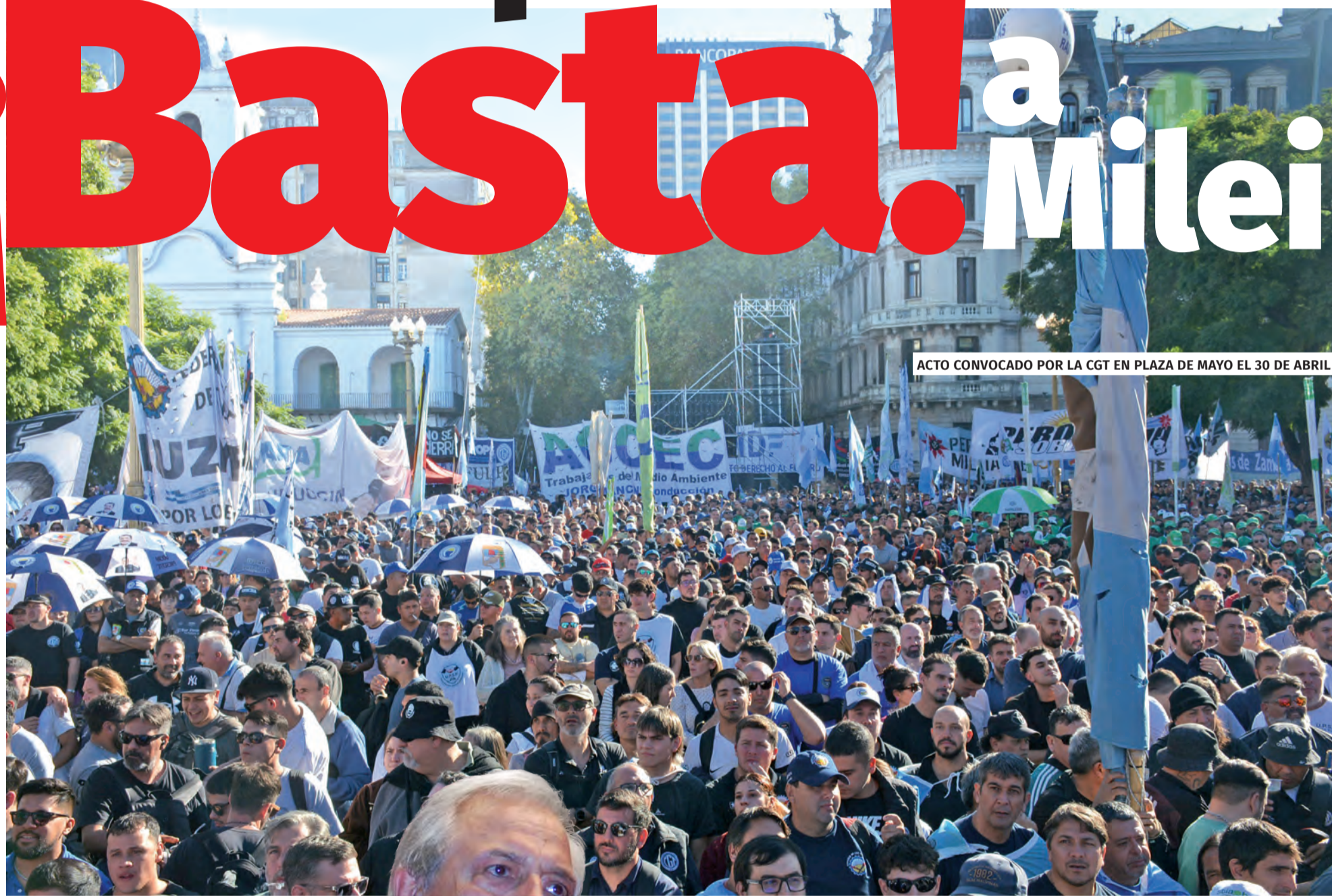
ACTO CONVOCADO POR LA CGT EN PLAZA DE MAYO EL 30 DE ABRIL