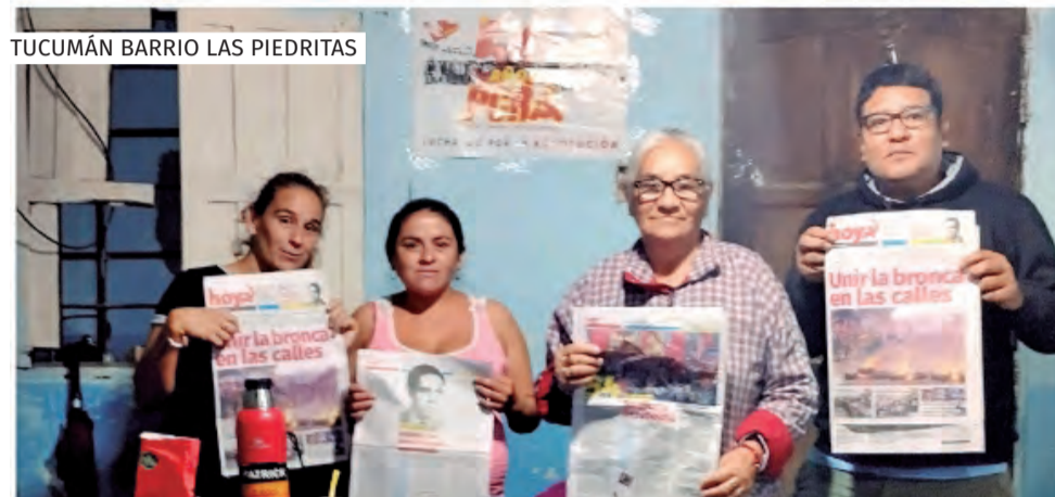
TUCUMÁN BARRIO LAS PIEDRITAS

En el debate surgió el repudio al gobierno, lo de Adorni, que vuelva Cristina, pero sobre todo, frases como; “no llego a fin de mes”, “para mí y mis hijos 50 mil mínimo por día para comer” “mi hijo usa la zapatillas de su hermano para ir a la escuela, no tengo para comprarle”, “comer un asado de achura