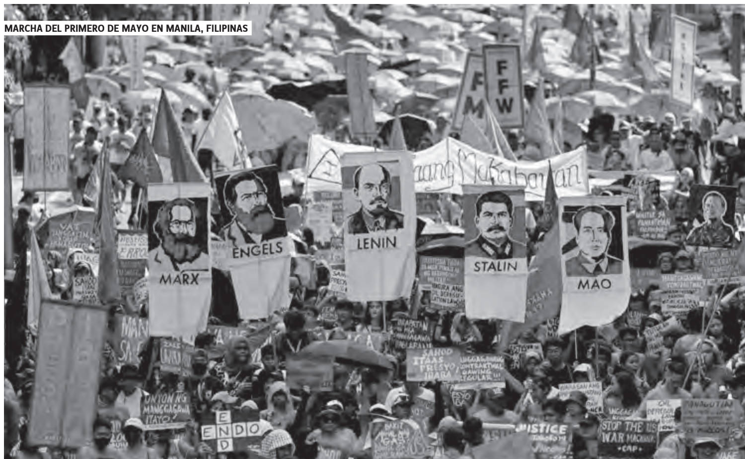
MARCHA DEL PRIMERO DE MAYO EN MANILA, FILIPINAS

esfuerzos para ampliar la unidad en los lugares de trabajo, estudio y vivienda, forjando multisectoriales que profundicen la lucha contra la miseria y la entrega que no se aguantan más.