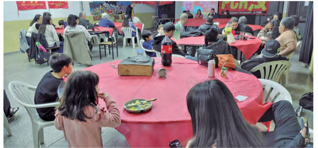
camino que nos marcó.