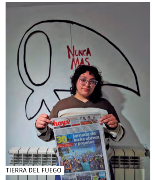
TIERRA DEL FUEGO

Desde la juventud, las y los compañeros de la Universidad Nacional de Quilmes pasaron por aulas ofreciendo la prensa. Nos cuentan que “Fue una experiencia muy positiva ya que, pudimos dar a conocer que nuestro Partido