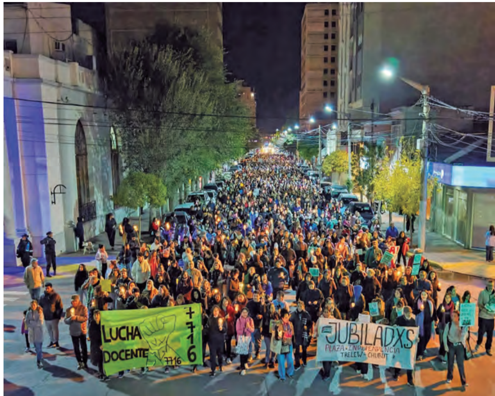
Superando los aprietos y las mentiras del gobierno, se sostienen importan-

Desde que asumió este gobierno provincial aplicó un ajuste salarial brutal. En la paritaria docente ofreció un 1,2% de aumento para el sueldo de abril, lo que fue rechazado por los sindicatos que convocaron un paro para el día 23 de abril. Con la perspectiva de que sea masivo y marchas multitudinarias, el gobierno dicta la conciliación obligatoria. Las conducciones sindicales de Atech (el principal sindicato docente, conducido por la lista Celeste), Amet, Sitraed, Sadop y UDA la acatan sin consulta a las bases. La bronca desborda a esas conducciones y se produce el "faltazo". En varios lugares de la provincia docentes deciden no ir a trabajar haciendo efectivo el paro que había sido levantado por las conducciones sindicales.