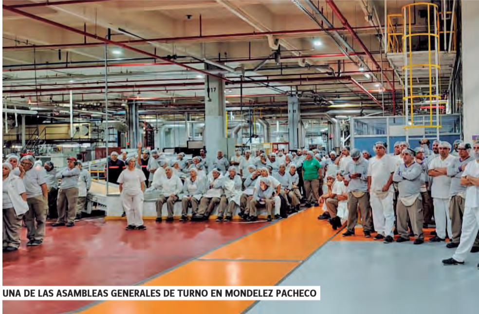
UNA DE LAS ASAMBLEAS GENERALES DE TURNO EN MONDELEZ PACHECO