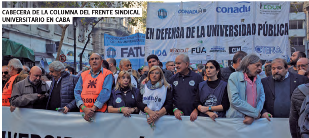
CABECERA DE LA COLUMNA DEL FRENTE SINDICAL UNIVERSITARIO EN CABA

“Un punto de inicio para empezar a bajar a este gobierno”