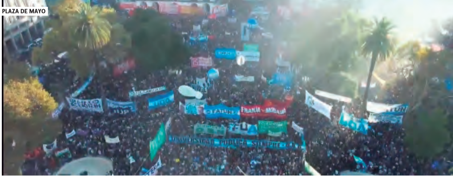
PLAZA DE MAYO