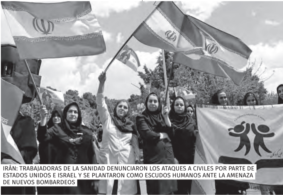
IRÁN: TRABAJADORAS DE LA SANIDAD DENUNCIARON LOS ATAQUES A CIVILES POR PARTE DE ESTADOS UNIDOS E ISRAEL Y SE PLANTARON COMO ESCUDOS HUMANOS ANTE LA AMENAZA DE NUEVOS BOMBARDEOS

y centros de día, y presentó una nueva ley en la que propone la incompatibilidad total entre el cobro de la pensión y tener un empleo formal.