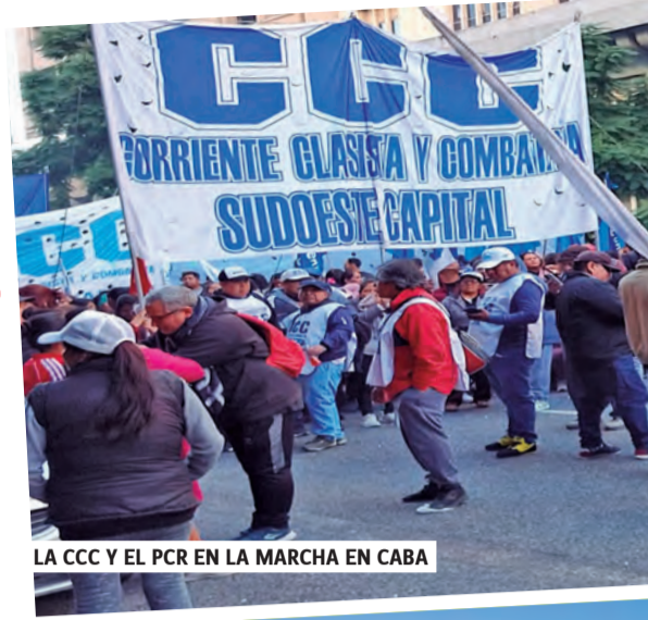
LA CCC Y EL PCR EN LA MARCHA EN CABA