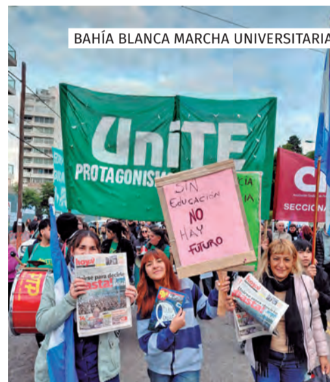
BAHÍA BLANCA MARCHA UNIVERSITARIA

cómo seguimos y cómo nos preparamos desde prensa ante los cambios bruscos que se puedan producir.