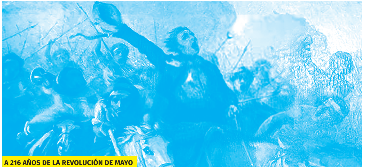
A 216 AÑOS DE LA REVOLUCIÓN DE MAYO

El 25 de Mayo se produjo el alzamiento insurreccional que posibilitó que los patriotas impusieran, en el Cabildo, la designación de un nuevo gobierno provisorio, la Primera