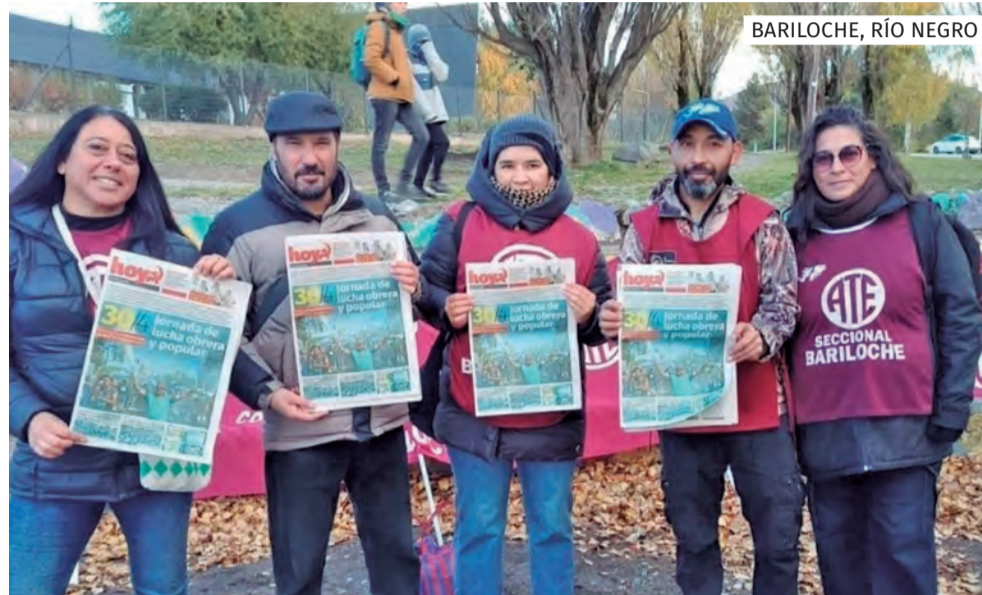
BARILOCHE, RÍO NEGRO

Lo que podemos precisar es que el conjunto del Partido y la JCR salieron para afuera en el Mes de la Prensa, eso es lo principal. Y eso fue al calor de las extraordinarias movilizaciones en todo el país contra la política de Milei, el 8 y 9 de marzo, del 24 de marzo, el 7 de abril, el 30 de abril y el 12 de mayo, protagonizadas por nuestro pueblo y nuestro Partido y la JCR. En cada marcha, en cada corte de ruta, en fábricas, en quintas y parajes, en lugares de estudio y trabajo, en la calle se piqueteó el semanario y la revista, se hicieron videos de difusión, se trabajó con todas las herramientas a nuestro alcance en las redes sociales y eso es mérito de las direcciones zonales y provinciales, de todas las compañeras y compañeros. Hay cosas que tendremos que seguir precisando colectivamente en cada dirección, en cada organismo, en cada comisión, en