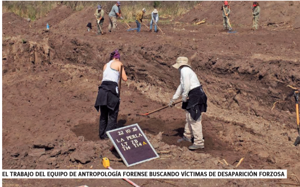
EL TRABAJO DEL EQUIPO DE ANTROPOLOGÍA FORENSE BUSCANDO VÍCTIMAS DE DESAPARICIÓN FORZOSA

Se encontraron elementos óseos que pudieron ser identificados al cotejarse con las muestras genéticas que aportaron las familias. Los hallazgos se localizaron en un sector que se denomina Loma del Torito. Este lugar fue identificado años atrás por declaraciones en los juicios por lesa humanidad. Los militares realizaron remociones de tierra y vaciaron grandes fosas comunes en 1979 (antes de la llegada de la Comisión Interamericana de Derechos Humanos) para ocultar evidencia, por lo que los restos encontrados están desarticulados y dispersos. Se han excavado 4 hectáreas que permitieron hallar evidencia y restos óseos. En marzo se habían identificado 12 víctimas; ahora fueron identificados