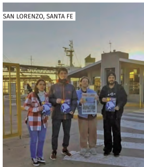
SAN LORENZO, SANTA FE