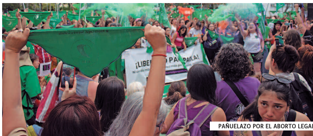
PAÑUELAZO POR EL ABORTO LEGAL