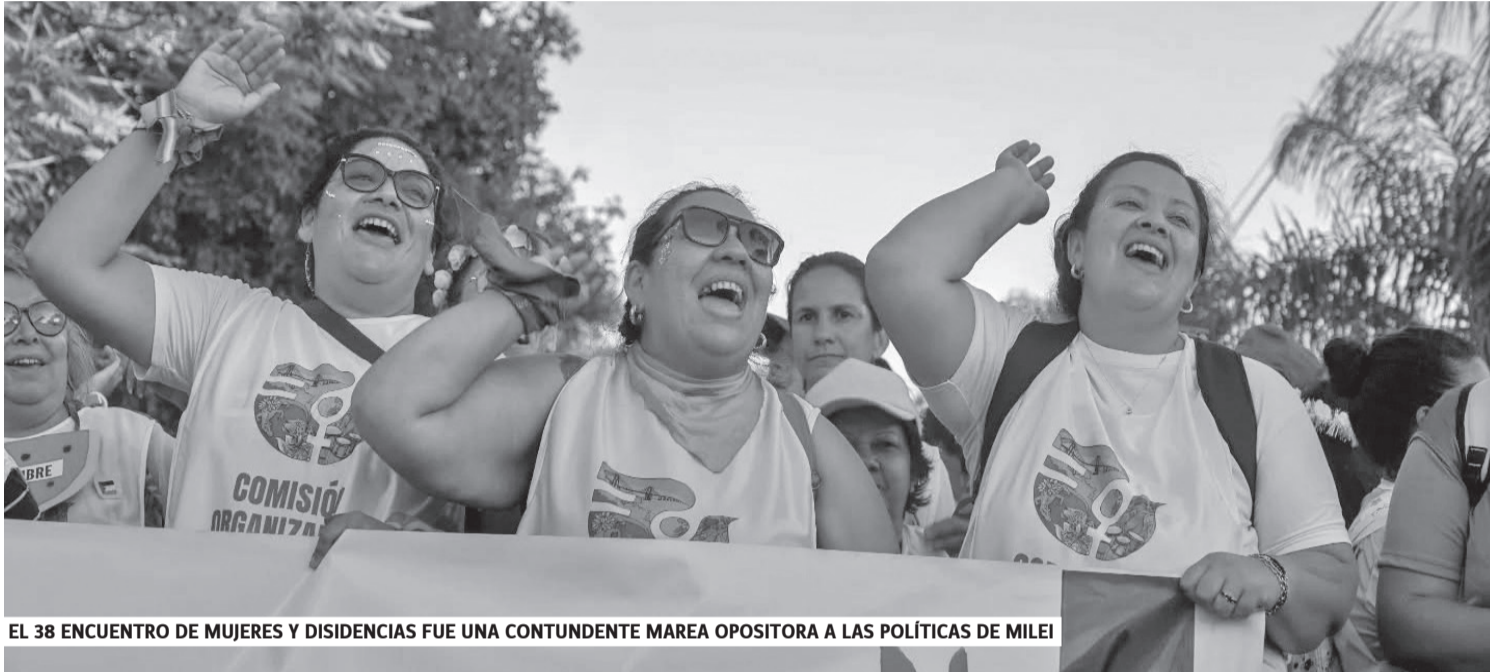
EL 38 ENCUENTRO DE MUJERES Y DISIDENCIAS FUE UNA CONTUNDENTE MAREA OPOSITORA A LAS POLÍTICAS DE MILEI