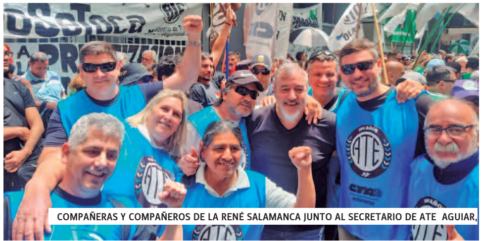
COMPAÑERAS Y COMPAÑEROS DE LA RENÉ SALAMANCA JUNTO AL SECRETARIO DE ATE AGUIAR.

Smith describió la situación en los distintos puntos del país y remarcó que la demostración de fuerza permitió “plantarse ante la amenaza” del Gobierno. “Tenemos que prepararnos para enfrentar la reforma laboral. Acá los que tienen que pagar la crisis son los ricos y los poderosos. Hay que generar impuestos a las grandes fortunas, porque el ajuste ya está llegando a provincias