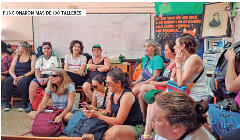
FUNCIONARON MÁS DE 100 TALLERES