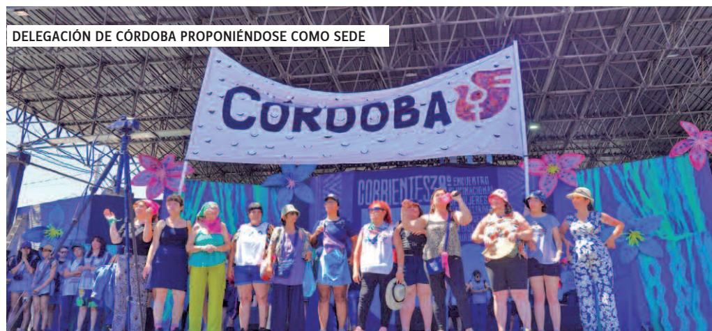
DELEGACIÓN DE CÓRDOBA PROPONIÉNDOSE COMO SEDE