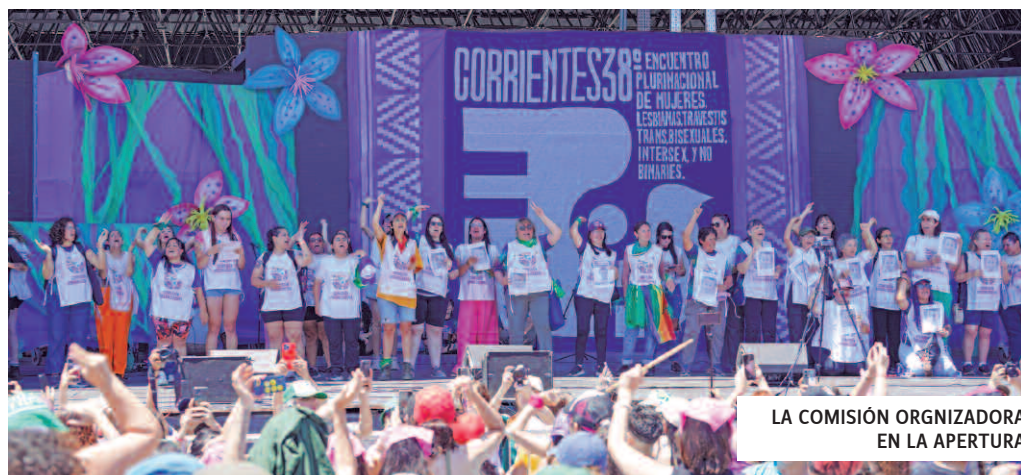
LA COMISIÓN ORGANIZADORA EN LA APERTURA