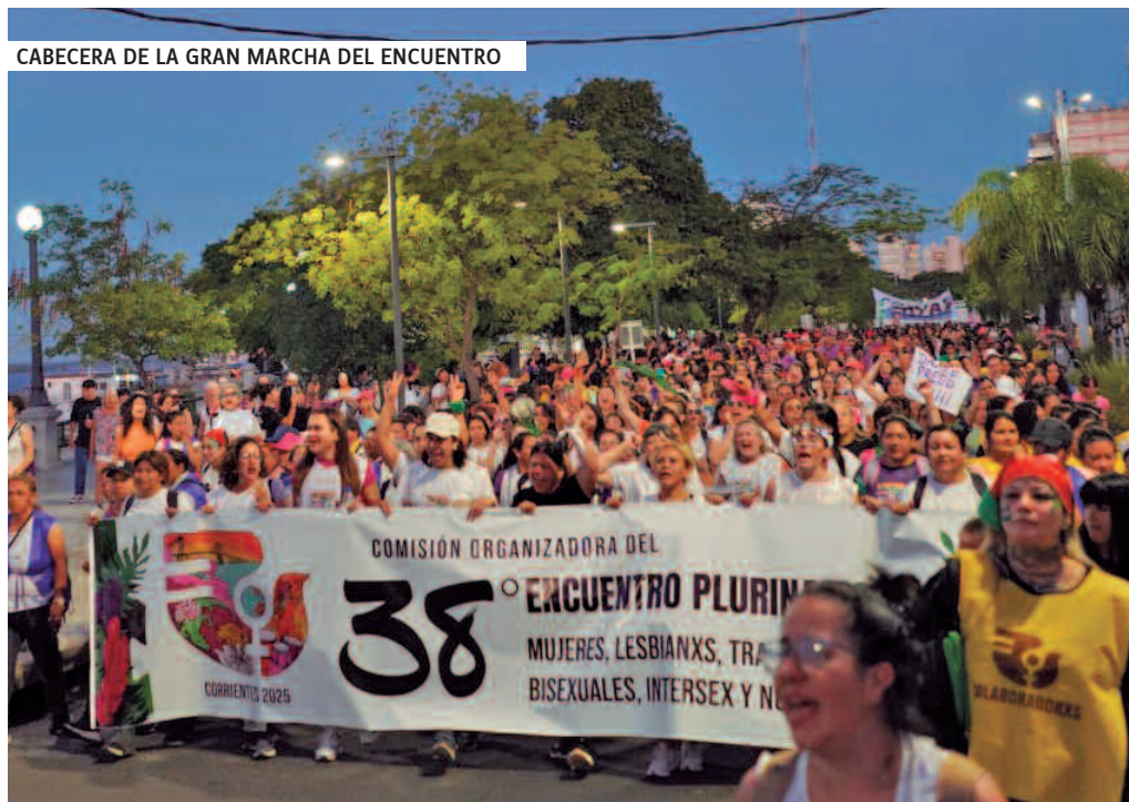
CABECERA DE LA GRAN MARCHA DEL ENCUENTRO

El domingo, cerca del mediodía, mujeres y disidencias de organizaciones barriales, sindicales, políticas y estudiantiles, se dirigieron al corazón del Parque Cambá Cuá para asistir a la asamblea trabajadora donde participaron: la CCC, Conadu H, Cam-