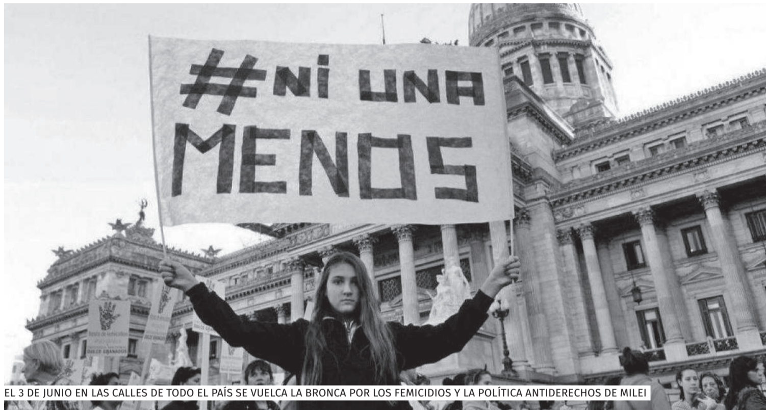
EL 3 DE JUNIO EN LAS CALLES DE TODO EL PAÍS SE VUELCA LA BRONCA POR LOS FEMICIDIOS Y LA POLÍTICA ANTIDERECHOS DE MILEI