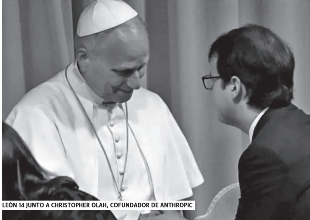
LEÓN 14 JUNTO A CHRISTOPHER OLAH, COFUNDADOR DE ANTHROPIC

Se conoce que la IA ha jugado y juega un papel fundamental en la guerra de Estados Unidos e Israel contra Irán, y cómo algunas empresas se están beneficiando de esto, con multimillonarios