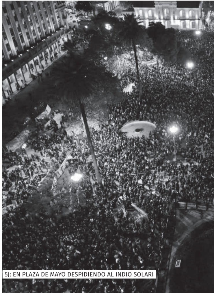
5J: EN PLAZA DE MAYO DESPIDIENDO AL INDIO SOLARI