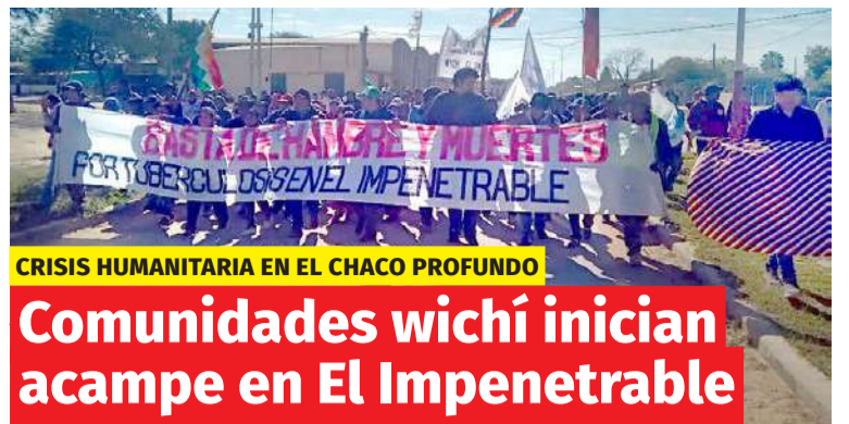
CRISIS HUMANITARIA EN EL CHACO PROFUNDO

Comunidades wichí inician acampe en El Impenetrable