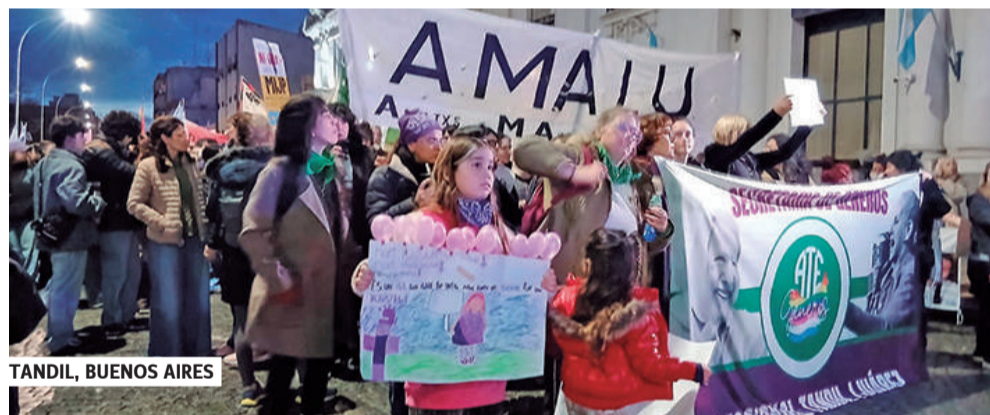
TANDIL, BUENOS AIRES

de crueldad, ajuste y silenciamiento. Denunciamos el brutal ajuste económico que golpea especialmente a las mujeres trabajadoras, jubiladas, madres y sectores populares. Basta de tarifazos. Basta de hambre y precarización.