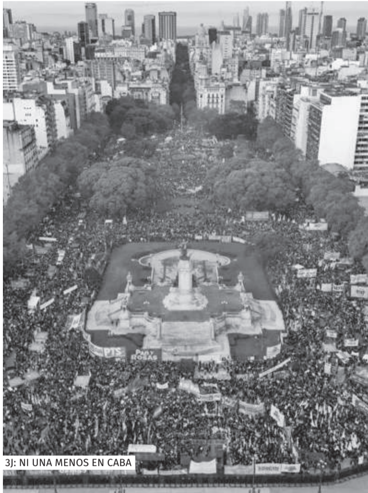
3J: NI UNA MENOS EN CABA