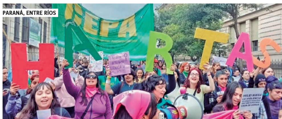
PARANÁ, ENTRE RÍOS