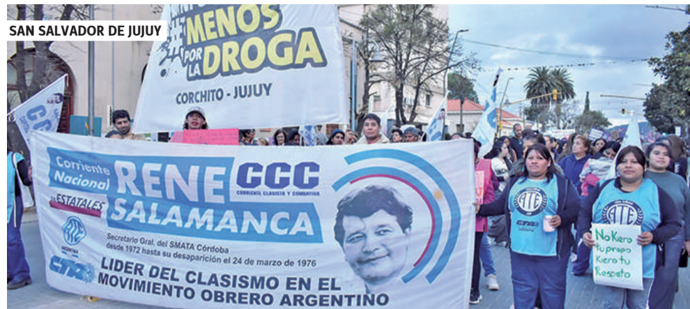
SAN SALVADOR DE JUJUY