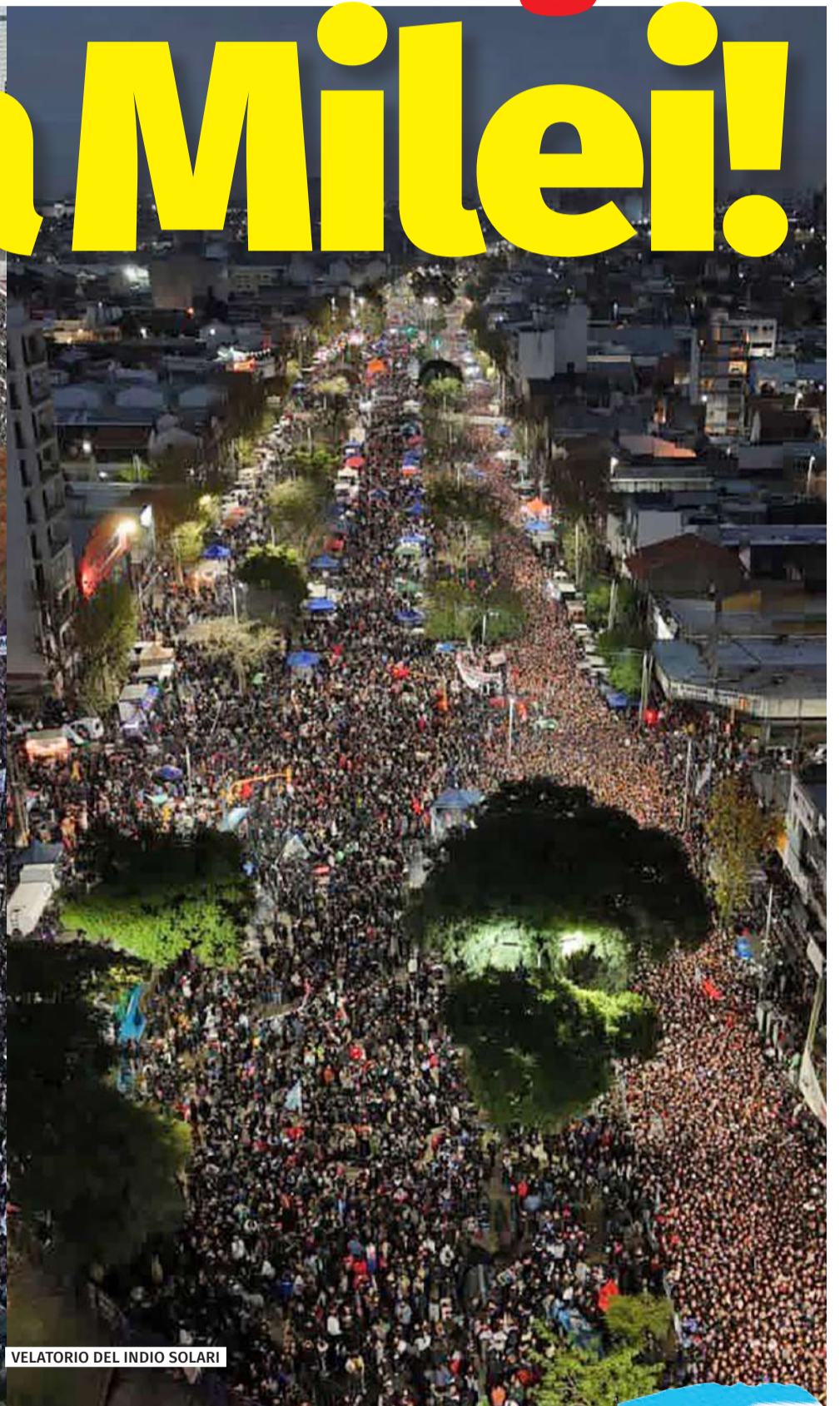
VELATORIO DEL INDIO SOLARI

BOLIVIA: MÁS DE UN MES DE REBELIÓN POPULAR “La demanda es que Rodrigo Paz renuncie”