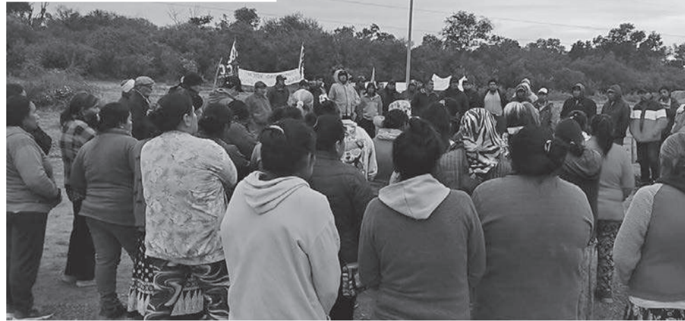
COMUNIDADES ORIGINARIAS ACAMPAN EN EL CHACO DENUNCIANDO EMERGENCIA ALIMENTARIA Y SANITARIA

En el continente africano, una vez más se conoce que la ambición capitalista está detrás del crecimiento de graves enfermedades. Ahora se sabe que el origen del brote de ébola que está asolando en el Congo y otros países está en una mina de oro donde las condiciones de trabajo son de una inmensa superexplotación, con los mineros totalmente expuestos a la contaminación.