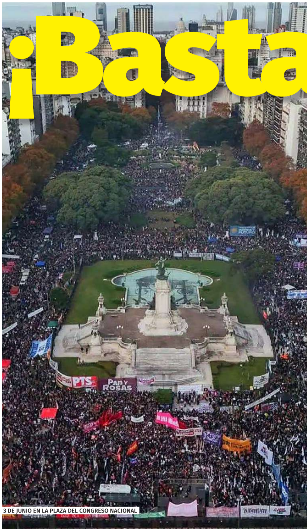
3 DE JUNIO EN LA PLAZA DEL CONGRESO NACIONAL