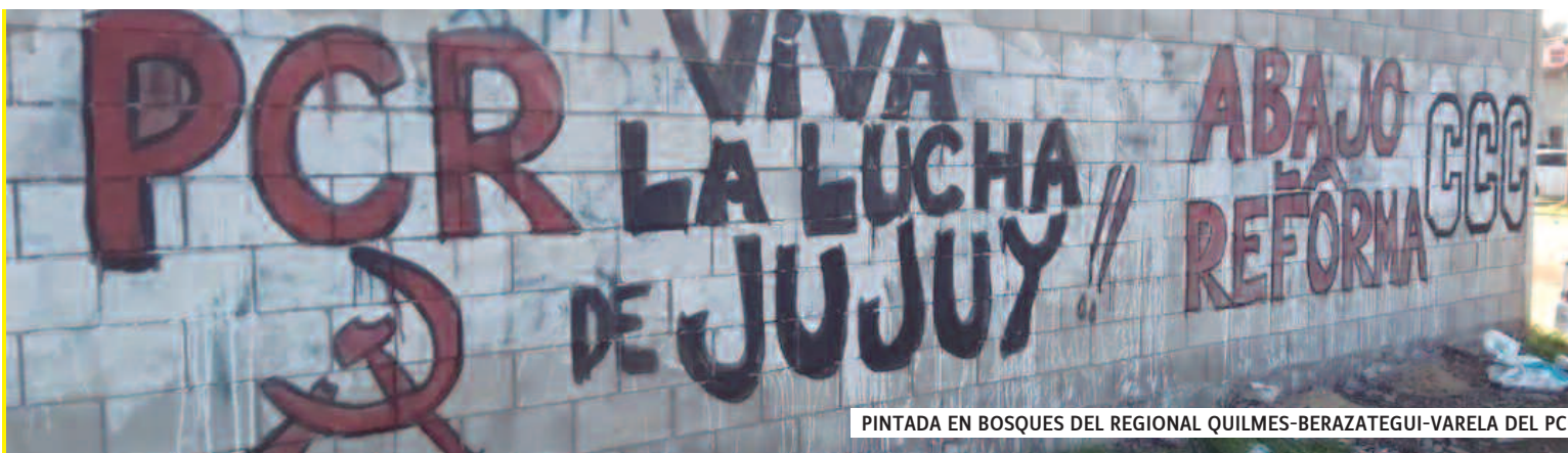
PINTADA EN BOSQUES DEL REGIONAL QUILMES-BERAZATEGUI-VARELA DEL PCR