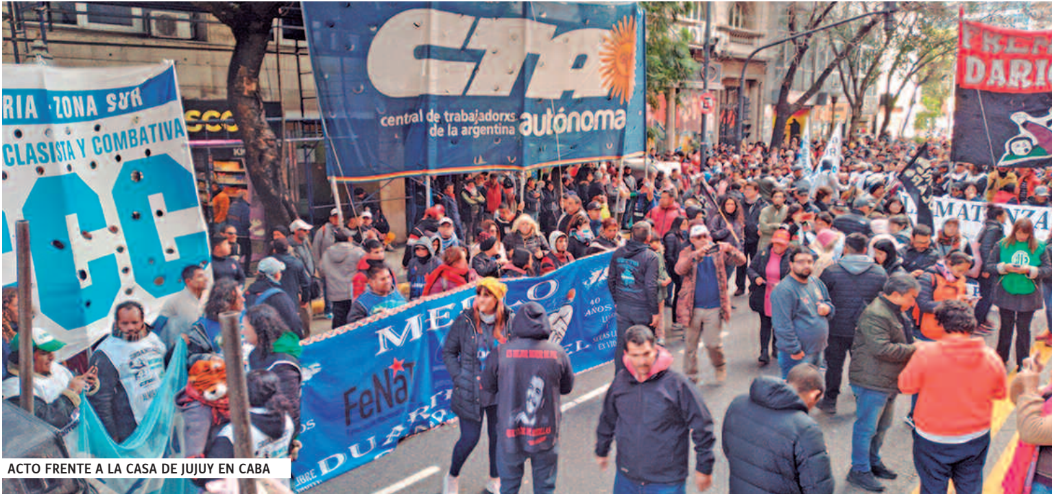
ACTO FRENTE A LA CASA DE JUJUY EN CABA

Al conocerse la nueva oleada represiva del gobierno de Gerardo Morales en Jujuy, con detenciones masivas en Humahuaca y San Salvador, una ola solidaria con la lucha popular se desplegó en todo el país, con movilizaciones, pintadas, conferencias de prensa y pronunciamientos.