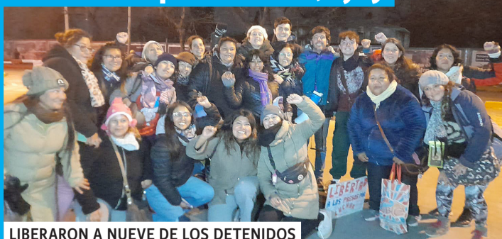
LIBERARON A NUEVE DE LOS DETENIDOS

Jornada nacional de lucha contra la represión en Jujuy