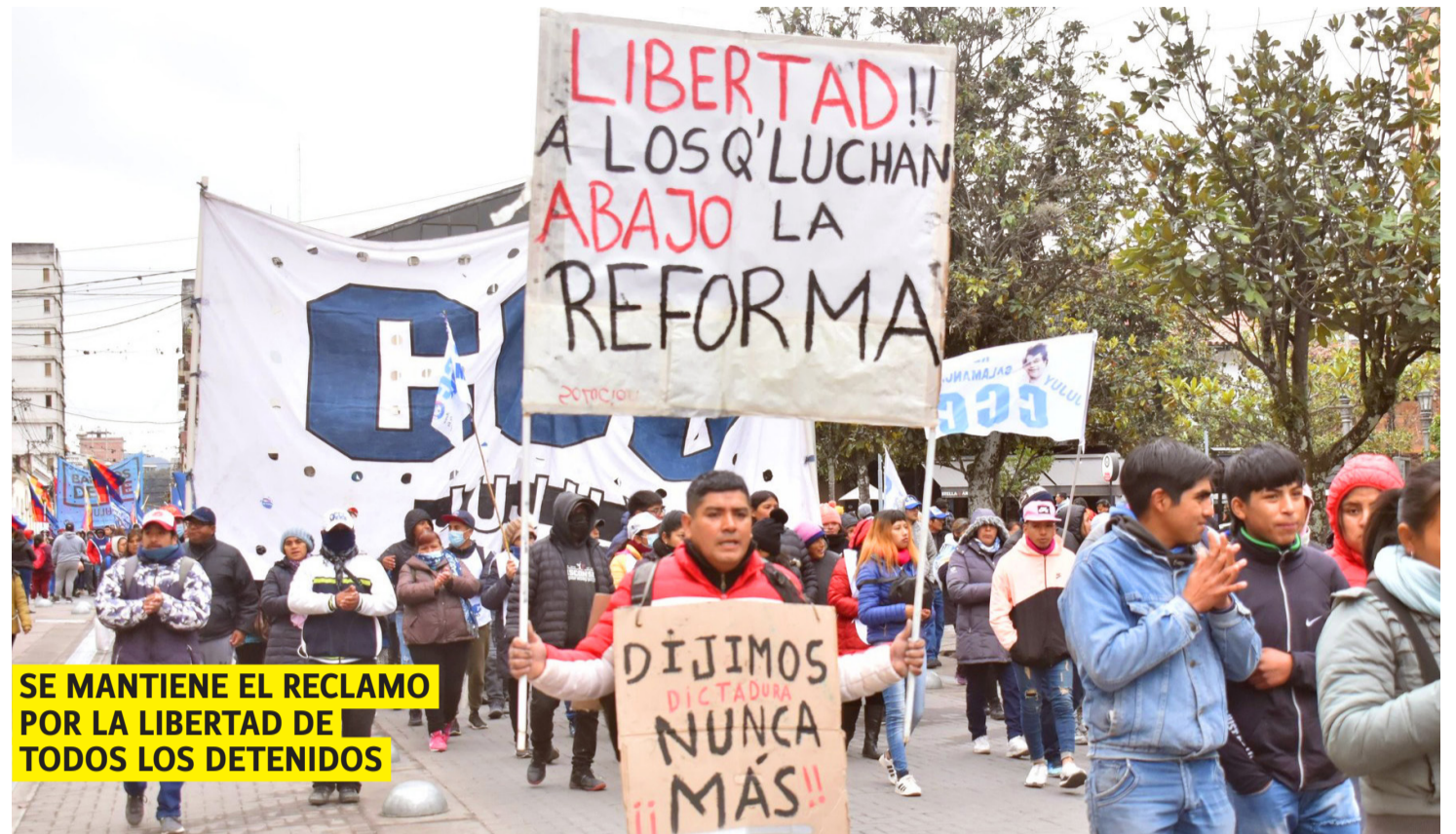
SE MANTIENE EL RECLAMO POR LA LIBERTAD DE TODOS LOS DETENIDOS