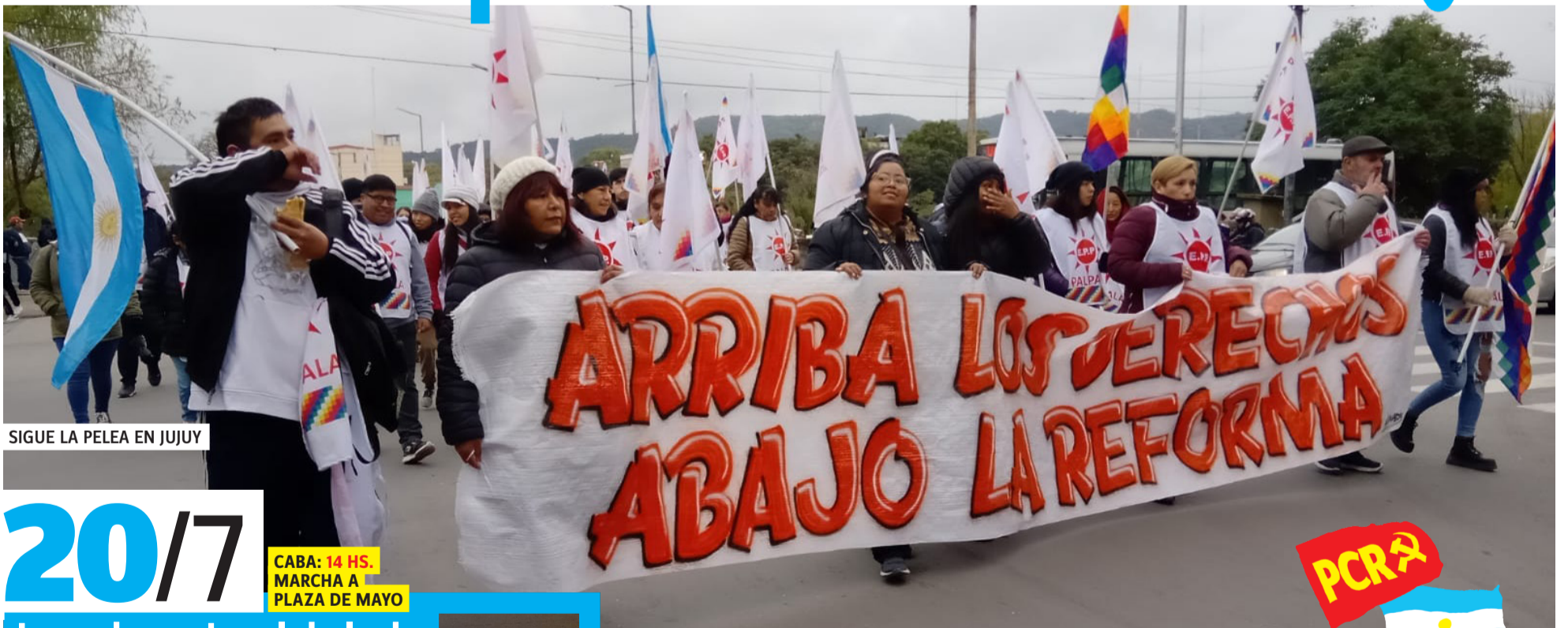
SIGUE LA PELEA EN JUJUY