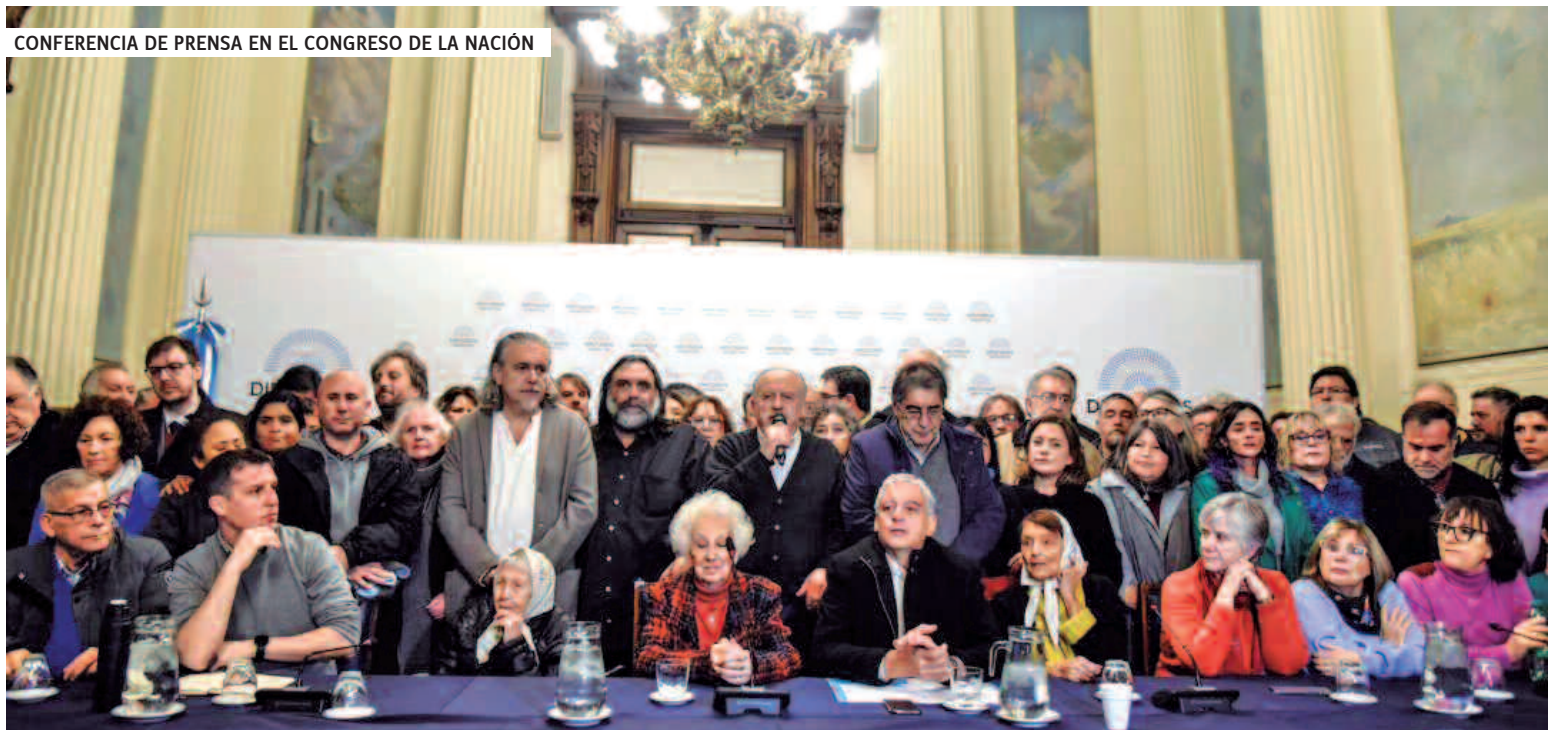
CONFERENCIA DE PRENSA EN EL CONGRESO DE LA NACIÓN