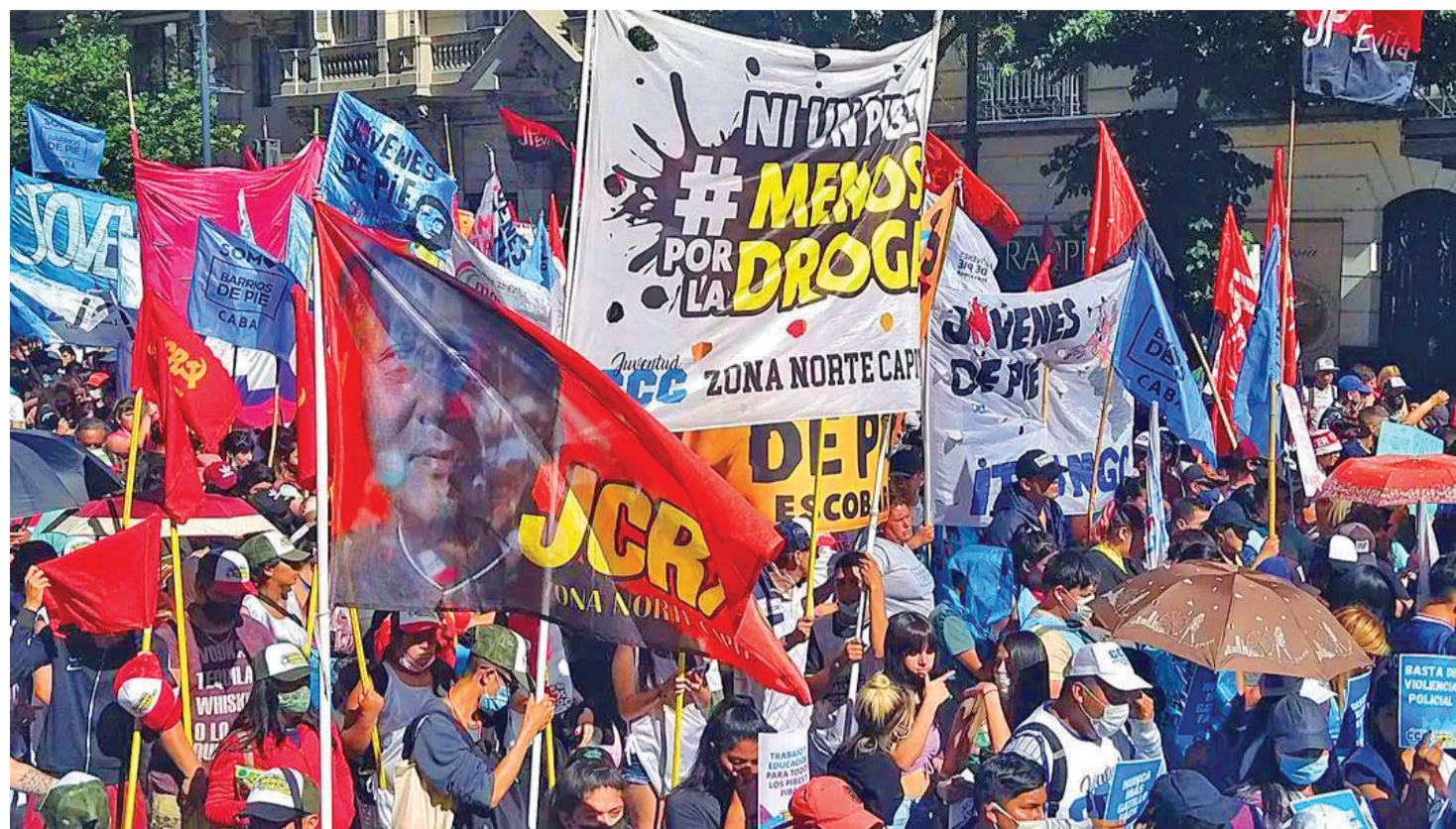
JUVENTUD COMUNISTA REVOLUCIONARIA

Como dijimos en el 10º congreso de la JCR, "las drogas son un mecanismo de dominación de la natural rebeldía que surge frente a las condiciones sociales, de vida y de trabajo de nuestro pueblo. Buscan que la juventud no se rebele ni luche por cambiar su reali-