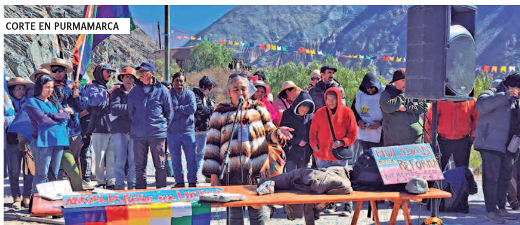
CORTE EN PURMAMARCA

¡Arriba los salarios. Arriba los derechos. Abajo la reforma! ■