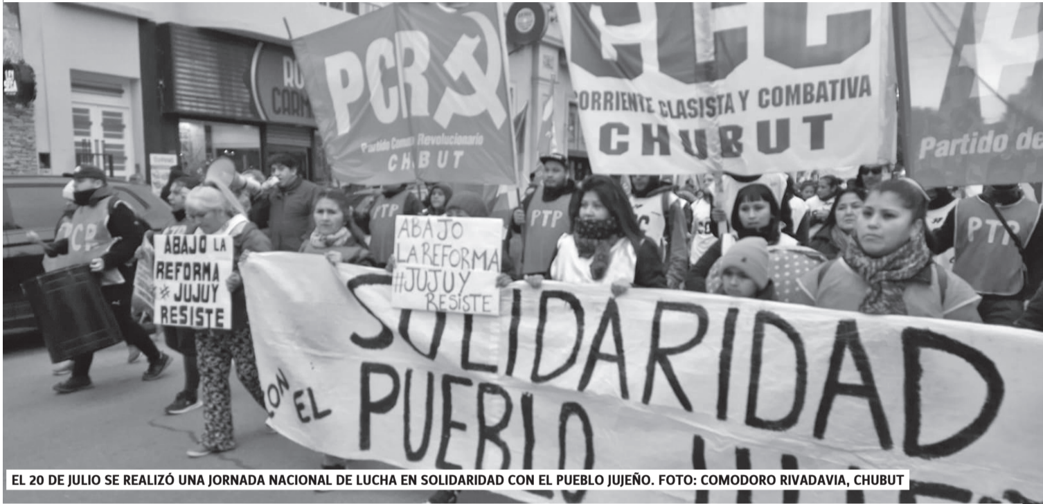
EL 20 DE JULIO SE REALIZÓ UNA JORNADA NACIONAL DE LUCHA EN SOLIDARIDAD CON EL PUEBLO JUJEÑO. FOTO: COMODORO RIVADAVIA, CHUBUT

El pueblo argentino no abandona las calles en defensa de sus derechos. La rebelión del pueblo jujeño es un salto en ese camino. Avancemos en la confluencia de las luchas con un paro activo nacional en solidaridad con Jujuy, por las emergencias populares y por la anulación del acuerdo con el FMI. Desde Unión por la Patria desplegamos la campaña electoral con nuestros candidatos y las Diez Medidas para avanzar en una salida a favor del pueblo y de la patria.