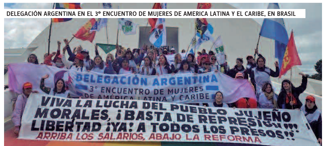
DELEGACIÓN ARGENTINA EN EL 3º ENCUENTRO DE MUJERES DE AMÉRICA LATINA Y EL CARIBE, EN BRASIL