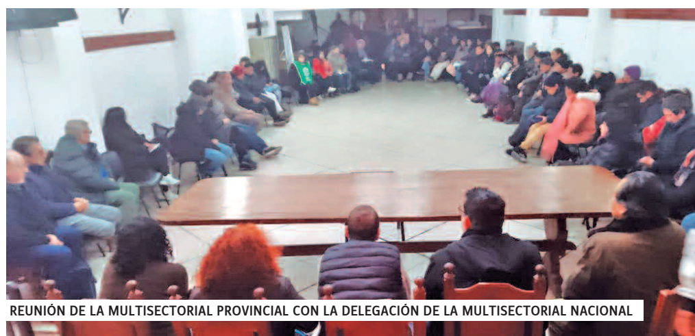
REUNIÓN DE LA MULTISECTORIAL PROVINCIAL CON LA DELEGACIÓN DE LA MULTISECTORIAL NACIONAL

que acá en Jujuy tuvo una multitudinaria y amplia convocatoria en la ciudad del Libertador General San Martín en el marco de las marchas contra los apagones del terror. Al cumplirse 47 años de La Noche del Apagón, se integró en la marcha la consigna de "Memoria, verdad y justicia" con el pedido de "Abajo la Reforma", en defensa de las libertades democráticas, el respeto del territorio de las comunidades y naciones originarias, y en contra del saqueo de nuestros recursos naturales.