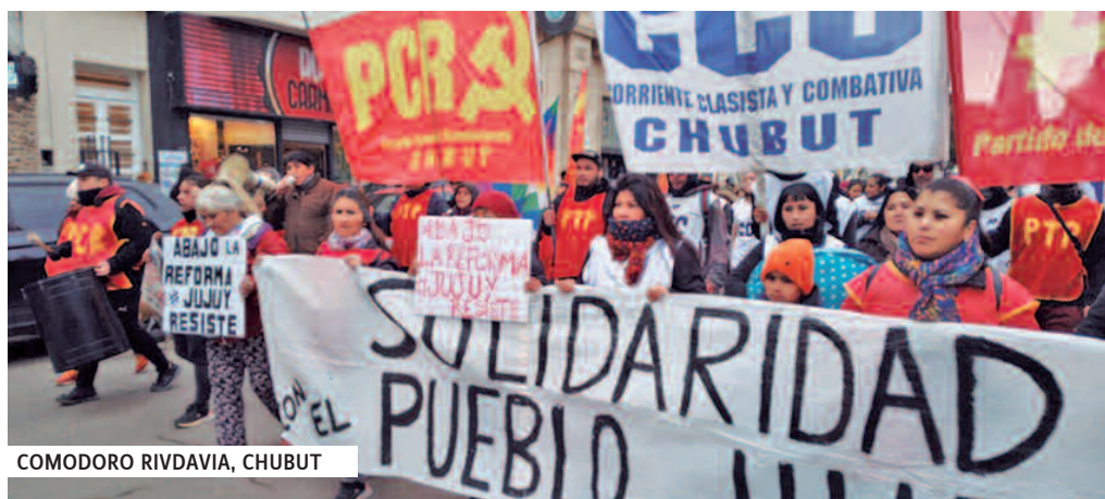
COMODORO RIVDAVIA, CHUBUT