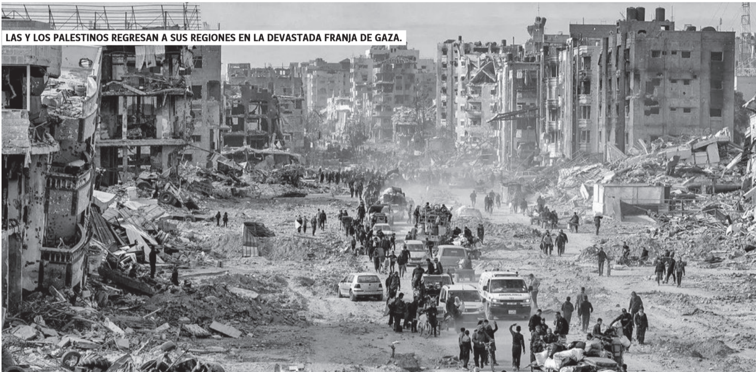
LAS Y LOS PALESTINOS REGRESAN A SUS REGIONES EN LA DEVASTADA FRANJA DE GAZA.