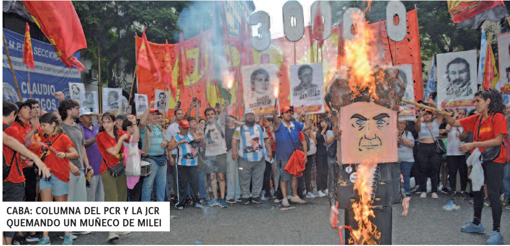
CABA: COLUMNA DEL PCR Y LA JCR QUEMANDO UN MUÑECO DE MILEI

En CABA, por primera vez en casi 20 años se logró una marcha unificada, y miles y miles, medio millón de personas según al-