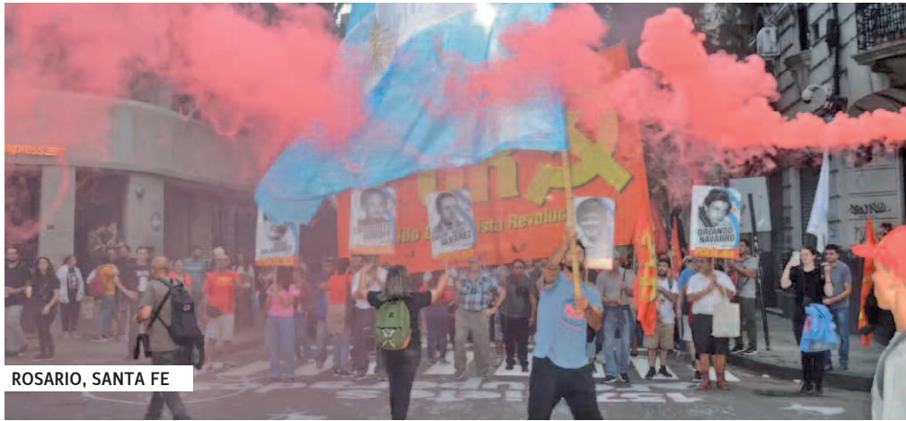
ROSARIO, SANTA FE

gunos medios, coparon el centro porteño. En la mezcla de organizaciones sociales, sindicales, políticas, estudiantiles, de derechos humanos, culturales, profesionales sobresalía la masiva participación juvenil.