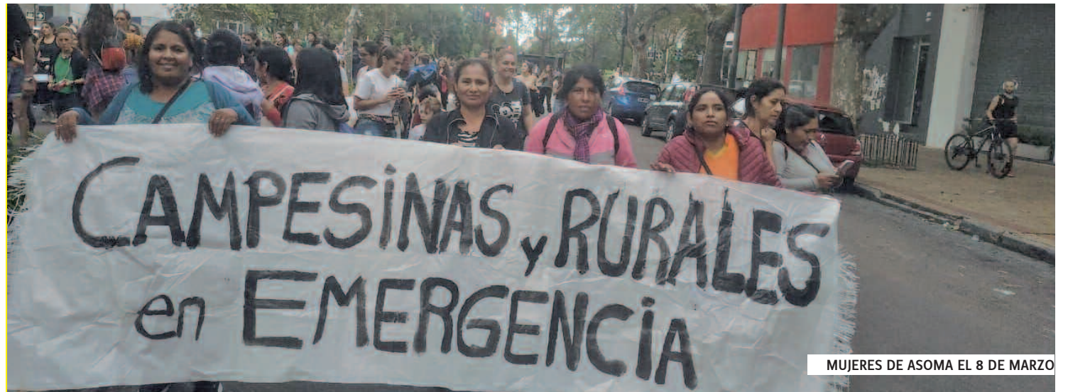
MUJERES DE ASOMA EL 8 DE MARZO

“Nosotros desde Asoma junto a otras organizaciones marchamos el 22 de febrero a Edelap, y ellos se cubren diciendo que no es decisión de la empresa, son normas que ellos están obligados a cum-