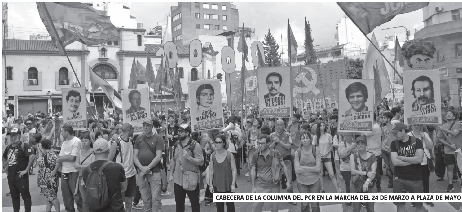
CABECERA DE LA COLUMNA DEL PCR EN LA MARCHA DEL 24 DE MARZO A PLAZA DE MAYO