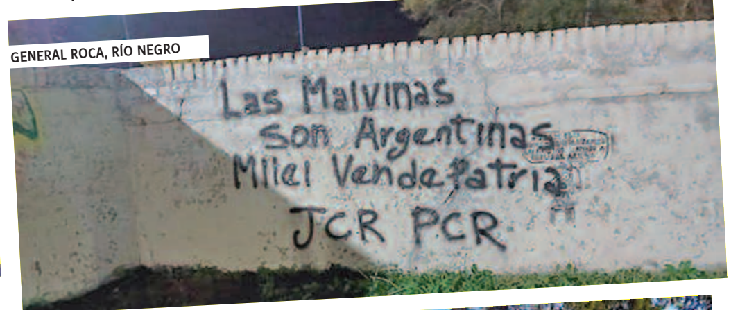
GENERAL ROCA, RÍO NEGRO