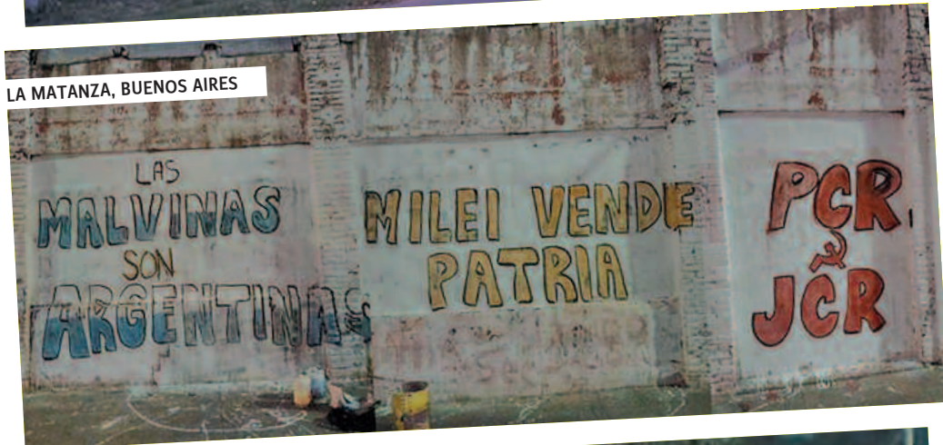
LA MATANZA, BUENOS AIRES