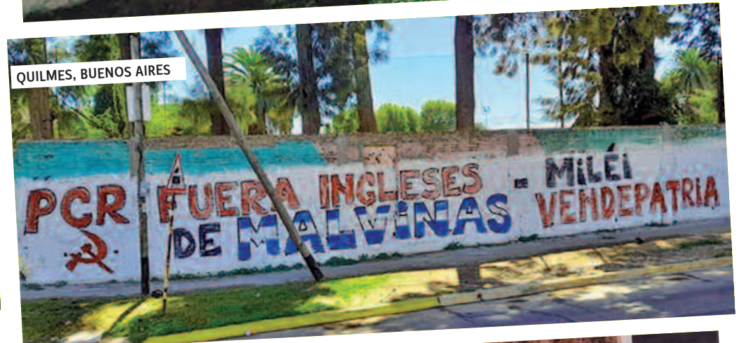
QUILMES, BUENOS AIRES