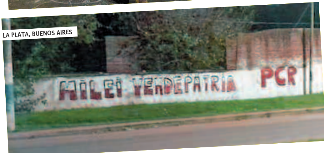
LA PLATA, BUENOS AIRES