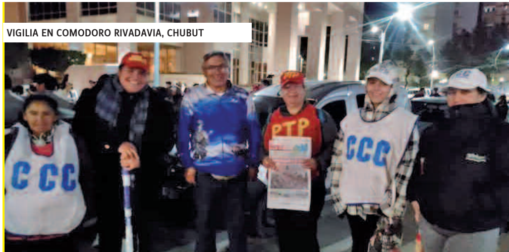
VIGILIA EN COMODORO RIVADAVIA, CHUBUT

En la provincia de Buenos Aires, entre otras actividades participamos de la vigilia de excombatientes de la zona en Berazategui, Quilmes y Varela. En las uni-