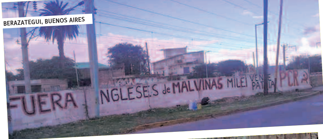
BERAZATEGUI, BUENOS AIRES

Compañeras y compañeros del PCR y de la JCR realizaron pintadas y pasacalles en varios lugares del país. Con ferrite, aerosol o stencil, repudiamos a los ingleses, reafirmamos la soberanía en Malvinas y denunciamos al vendepatria de Milei en paredes y muros de varias ciudades y provincias, como Quilmes, Berazategui, Varela y Bernal. Zona Norte CABA. Zona Agraria La Plata, Romero y Abasto. La Plata (casco céntrico). Ensenada. Chascomús. Bahía Blanca. San Nicolás. Entre Ríos. Mendoza. Río Negro y Santa Cruz. ■