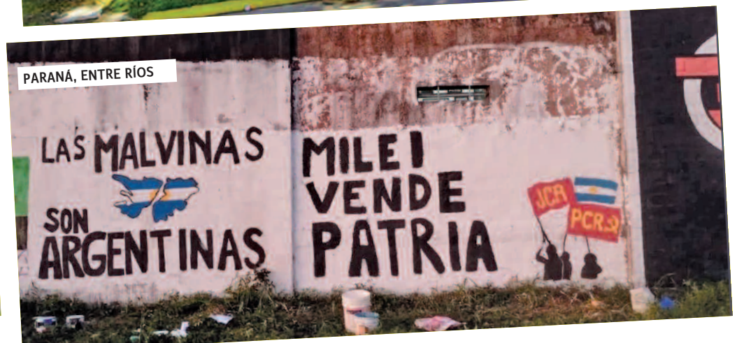
PARANÁ, ENTRE RÍOS