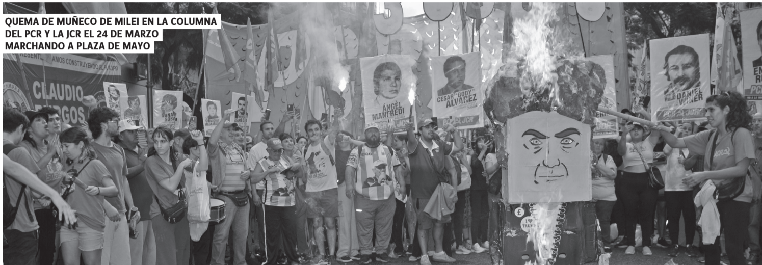
QUEMA DE MUÑECO DE MILEI EN LA COLUMNA DEL PCR Y LA JCR EL 24 DE MARZO MARCHANDO A PLAZA DE MAYO