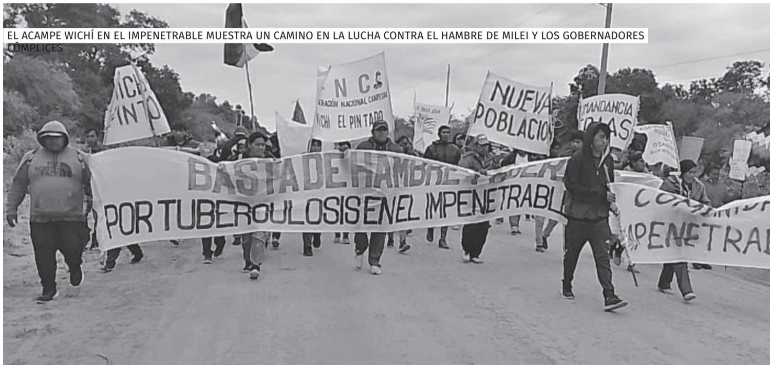
EL ACAMPE WICHÍ EN EL IMPENETRABLE MUESTRA UN CAMINO EN LA LUCHA CONTRA EL HAMBRE DE MILEI Y LOS GOBERNADORES CÓMPlices