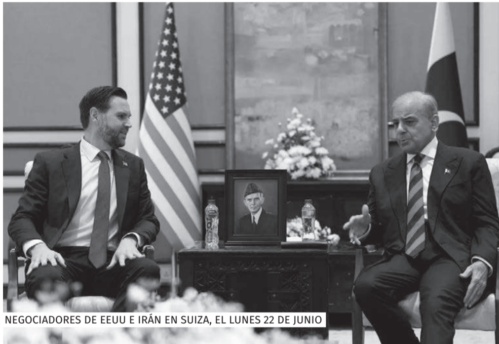
NEGOCIADORES DE EEUU E IRÁN EN SUIZA, EL LUNES 22 DE JUNIO

Luego de esta firma, el gobierno fascista de Netanyahu en Israel siguió intentando sabotear el acuerdo, con criminales bombardeos en el Líbano, que causaron al menos un centenar de muertos. Irán contestó cerrando nuevamente el paso del Estrecho de Ormuz, cierre que en estos meses fue uno de los