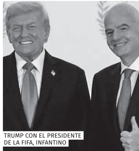
TRUMP CON EL PRESIDENTE DE LA FIFA, INFANTINO

Después de haber tenido que retroceder ante la valentía del pueblo y la na-